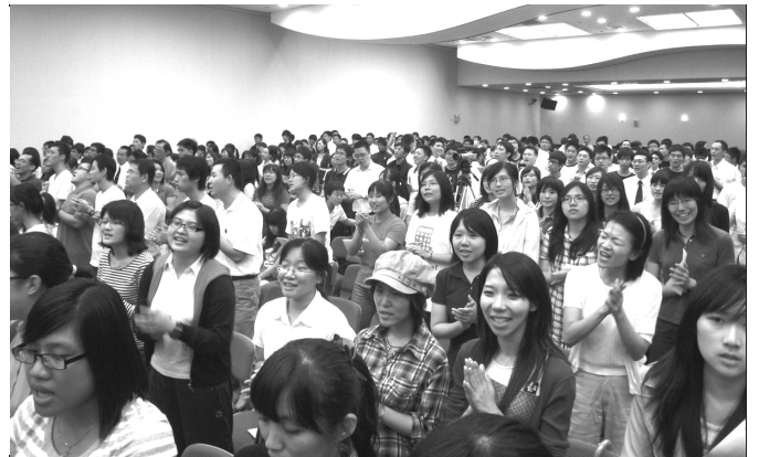
▲ 在大學青年福音大會中眾人歡唱詩歌

榮耀的生命，以彰顯神榮耀的豐富。但是，因著罪進到人的裏面，以致器皿變得污穢。福音信息配合生動的圖文播放，與會者對人作為神的器皿被玷污留下深刻的印象。好在神為人豫備救恩，藉著釘死、復活、和升天，祂成了賜生命的靈；人只要相信接受祂，便可得著神那永遠、榮耀的生命。當服事弟兄一呼召，許多人毫不猶豫的上台，表示願意受浸。