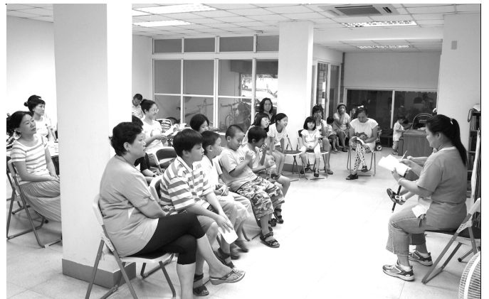
▲ 四十五會所兒童小排聚會