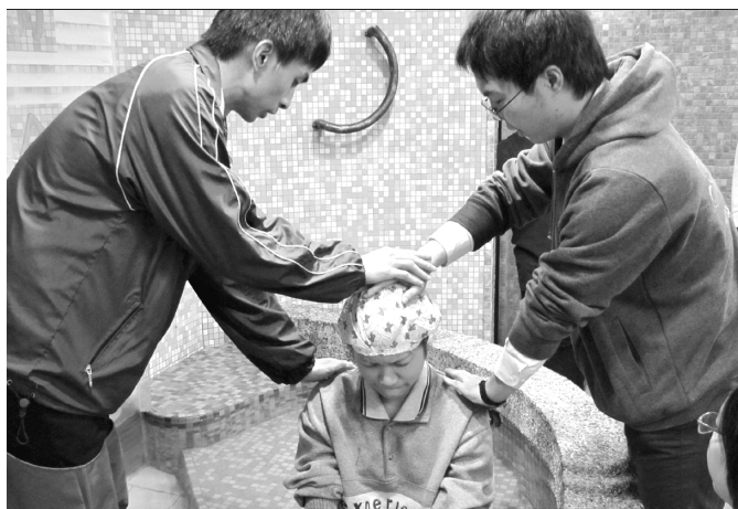
▲ 弟兄們為新人施浸

爲 接續二二七新春福音相調大會的負擔，弟兄們緊急交通後，南一區從三月十三至二十七日，有爲期兩週的加強開展，並於二十六日在三會所，