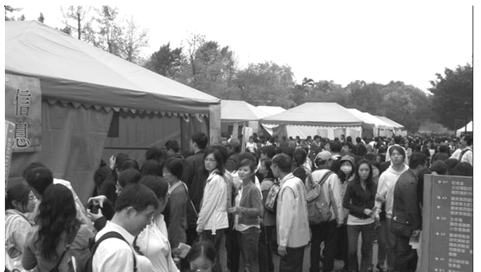
▲ 戶外福音棚參加人潮絡繹不絕

會中一段對台北市召會的介紹，讓初信者大開眼界，原來在台北市有這麼多基督徒，並且到處都有聚會的地點，讓人過著豐富的召會生活。接著，全時間訓練學員詩歌展覽，在靈裏高昂的歌聲中，傳達出奉獻愛主的心志，把聚會帶到高點。而主的恢復和海外開展的介紹，不僅使初信者認識召會正確的立場，也加強眾聖徒開展的心願。