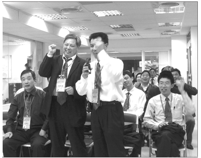
▲ 在相調聚會中，弟兄姊妹歡樂唱詩享受主

我們在離別時，強忍淚水。感謝主！藉著接待服事，我們能親身經歷以弗所二章十九、二十二節所說的：『你們不再是外人和寄居的，乃是聖徒同國之民，是神家裏的親人。』並且，『在祂裏面同被建造，成為神在靈裏的居所。』為著這一個美妙的宇宙大家庭，我們讚美主！ (林旭峰)