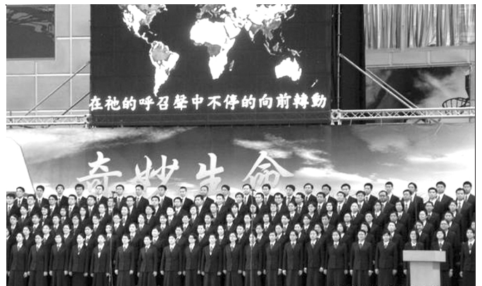
▲ 全時間訓練學員詩歌展覽