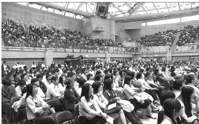
▲ 青年人踴躍參與本次大會

大會一開始，在弟兄們的介紹下，數百位海外聖徒起立向眾人招手，見證基督身體的合一和榮美。會中弟兄姊妹的見證也令與會者相當感動。一位受賭博轄制、不能自拔的弟兄，因著接受基督這奇妙的生命，人生有了重大的改變，妻子也與他破鏡重圓，並以基督作爲他們之間和平的聯索。一位外表光鮮亮麗的藝人，過著不爲人知的空虛生活，如今卻以基督作他的生命，與眾聖徒同過召會生活，得著真正的滿足。一位名醫在工作上不憑自己的能力，而是凡事謙卑的尋求並順從那靈的引導。這些