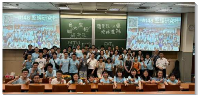
▲聖徒們禱告配搭得青年人

在開學之際，台大校園藉著社團聯展的舉辦，也藉著台科大的新生英文會考和新生體檢，我們一共接觸到六