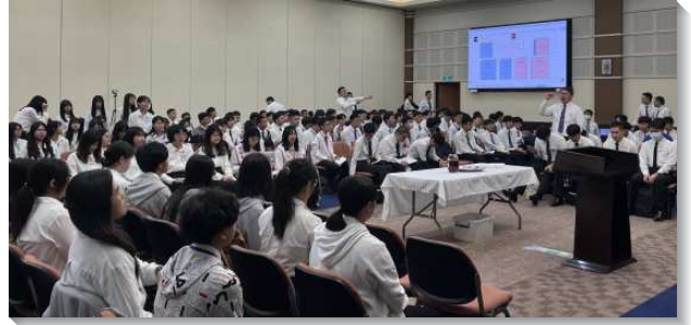
▲高中中幹聖徒在會中禱告

因著信息的加強和同伴間彼此激勵，青少年的靈都越來越火熱。表定早晨六點半開始團體操練唱詩、禱