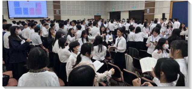
▲高中中幹聖徒在會中唱詩禱告

許多學生弟兄姊妹與服事者分享的見證，激勵了很多青少年們，盼望也能實行他們已過所作的。一位去年參加高中中幹成全的弟兄，當時宣告要在新的高中成立校園排。主應允了他的禱告，不只讓他聯繫上一位久未聚會的姊妹，還豫備了一位也是姊妹的老師來配搭，老師一次便邀了七位福音朋友來參加聚集，因此百齡高中校園排就成立了。讚美主！