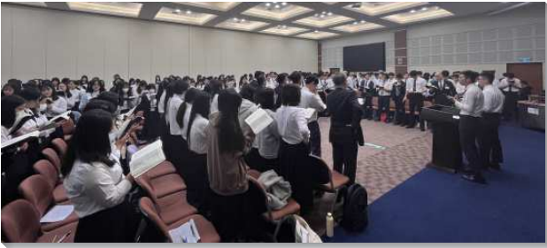
▲高中中幹成全在中部相調中心舉行

信息中說到，約瑟是一個作夢的人，神啓示祂的子民都是生命的禾捆、發光的星，這異象管治並支配約瑟的一生，使他能活一個聖別的生活。約瑟也是牧人，他在受苦的年間，積蓄了豐富，並有生命的供應。因著約瑟是一個服在神所量給他一切環境之下的