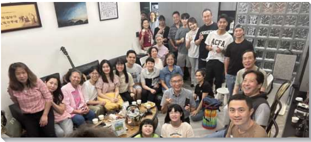
▲聖徒們同心合意傳福音得人

五十會所聖徒看見『我不以福音為恥；這福音本是神的大能，要救一切信的人…』（羅一16），在聖經註解中啓示『大能』意指能突破一切障礙的強大能力。這大能就是復活的基督自己，那賜生命的靈，要救一切信的人。因著神的憐憫，今年本會所的福音行動十分蒙恩，不只因著聖徒們同心合意的配搭，不住的禱告，更看見基督的復活大能，藉著聖靈的運行，使神的