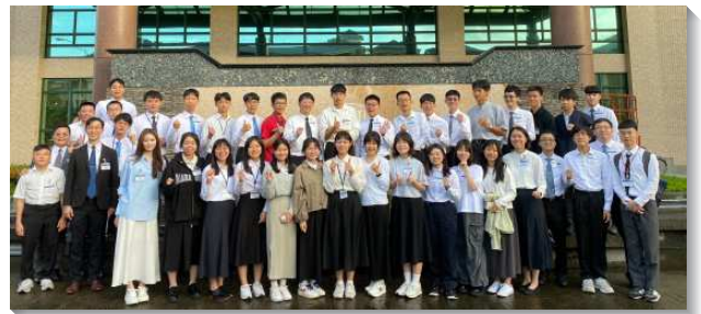
▲全台大學聖徒參加特會

第二和第三天早上安排團體晨興，有清晨系列的信息，帶領新生們在晨興中藉著呼求主名和禱讀經節操練靈，並奉獻自己，在開學後分別每早晨的時間，到主面前接觸祂、與祂有交通，得著真實的復興，自然能走新路、過得勝的生活。