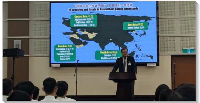
▲全台大學新生特會專題信息

第三篇信息為『神的經綸與奉獻愛主』，信息一開始著重在神的經綸，弟兄題醒學生們要作敞開的器皿，向著神的分賜敞開，並且給學生們兩個可以實際應用的點，第一就是要花時間來讀聖經，使我們可以藉著神的話而得著分賜，並建立個人禱告的習慣。第二就是住弟兄姊妹之家，在這樣的環境裏，每天都接受神聖的分賜，使我們的生活被翻轉。信息的末了總結在作主熱愛