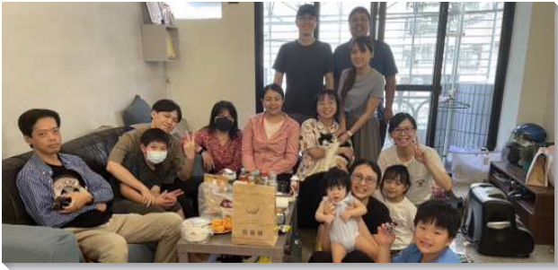
▲聖徒們竭力傳福音帶人得救

的拯救。約十五章五節：『我是葡萄樹，你們是枝子；住在我裏面的，這人就多結果子；因為離了我，你們就不能作甚麼。』我們看見要帶人得救，最重要的是『住在主裏面』，不住在主裏面，就不會有從主來的能力。傳福音不是口才或恩賜的問題。因著主話的光照，聖徒們與主的交通更深，認罪對付的事更多，禁食屈膝更迫切。聖徒們之間也有許多的連線禱告，列名單交通福音朋友的情形，跨區彼此配搭，因此帶下從主來的能力。最後不只是結果子更多，聖徒們與主的聯結也更多。