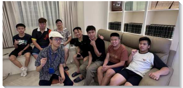
▲聖徒陪伴青少年進入召會生活

長，也建立青少年晨興及晚禱小組。按照國、高中及青職，運用線上群組天天一同追求並享受。青年人藉著每早晨享受主的話，在一天的開始就充滿主的同在，這使他們的靈得滋養。並透過禱讀和小組分享，彼此激勵、代禱，在屬靈追求胃口上持續增長。