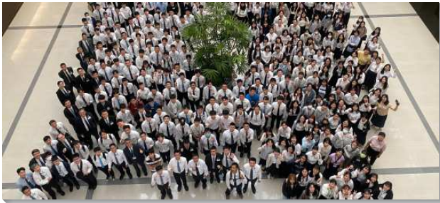
▲全台大學新生特會在中部相調中心舉行

本次特會有三篇信息和兩堂專題，信息綱要主要出自初信讀本（二）。第一篇信息為『調和的靈與呼求主名』，說到我們基督徒的生活乃在於靈，因為今天基督已經成為賜生命的靈（林前十五45），並且就在