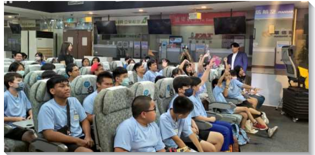
▲少年們參與得榮生命體驗營—航空體驗

的展示他們的收穫和成長。隊輔精心準備的話劇，更鼓舞所有少年勇敢追夢的決心，讓夢想的花朵得以綻放。