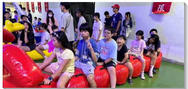
▲少年們體驗生命的喜樂

短短三天的時間，少年們從最初的陌生到後來彼此熟悉，建立了深厚的友誼。透過各種具有挑戰性的活動，他們不僅培養團隊合作精神，也提升了個人的自信心。職涯體驗課程開闊他們的視野，激發了對未來的思考。而隊輔個人的經歷分享，讓少年們深刻感受到遇到事情時，正向思考和積極面對的重要性。與此同時，擔任隊輔的大專生，雖在服務過程中經歷各種挑戰，也為他們的成長帶來很大的助益。他們學習如何帶領課程、活動，並與不同年齡的少年互動，體驗到付出的喜樂。