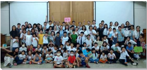
▲聖徒們參加港湖大區親子品格園

兩天一夜的品格園中，安排『穩、忍、深』的屬靈課程，幫助兒童們認識性格的意義、背誦三字訣和七字訣、進入十首詩歌帶動唱、藉著聖經人物故事進行親子