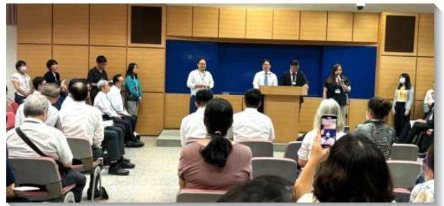
▲中山大同區夏季現場訓練

經歷、享受並彰顯基督是神聖啓示的心臟，也是神永遠經綸的中心思想。特別在第五篇信息說到享受基督作爲新約禧年的實際，題醒我們今天在恩典時代，要藉主的話享受基督作爲恩典，享受到一個地步，使我們能無憂無慮、無牽無掛、無缺無乏、無病無災，沒有難處，一切應心，萬事如意，逍遙自在，狂喜歡騰，因爲我們已經歸回神作我們的產業，也在基督裏從一切轄制底下得著釋放與自由。藉由弟兄們釋放話