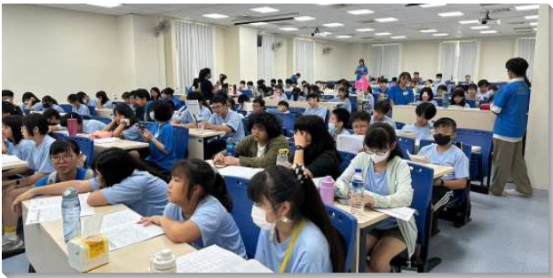
▲少年們參加得榮基金會生命體驗營

這次體驗營結合城市科大，設計了『航空體驗』和『我是主廚』兩門體驗課程，並藉著聖經內容的啟示，引導少年們認識人生的無限可能性。在觀光系教授帶領下，少年深入瞭解空服世界的奧祕。教授不僅介紹空服常識，包括機上救生和逃生安全措施，並且讓學員進行地勤服務的實務操作，學習機上送餐和美姿美儀等。