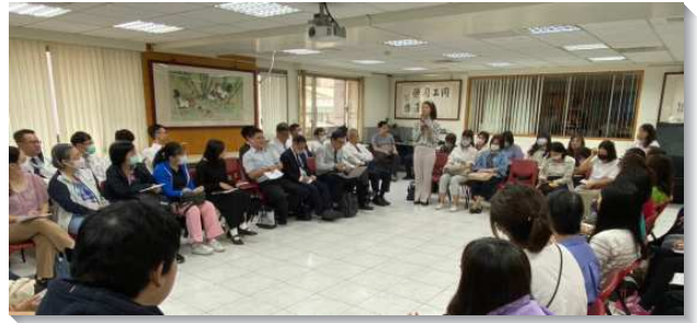
▲ 聖徒們在聚會中分組交通研討

在成全聖徒上則是看見開家的益處，不僅有屬靈的傳承，也能讓孩子操練一同盡功用。另一面也幫助人看見『需要』，無論週間、週末都需要有人把家打開，週間開家使全職的媽媽可以來，週末開家則是讓在職的媽媽可以來。越多的時段有家打開，就有越多的機會讓人可以來。中壯年姊妹們對於年輕媽媽的牧養及陪伴更是需要，供應話語、引導媽媽們享受主並一起禱告，使媽媽們生命更長大，度量更擴增。有姊妹見證，將客廳打開作兒童排後，隨著人數的增多，甚至將主臥室也打開，隨後主就將恩典及祝福一直加給他們，使人數越發繁增。