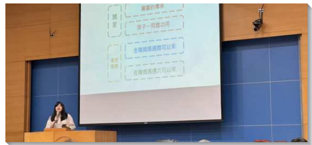
▲ 聖徒在聚會中作見證

第三，在小五、六銜接方面，首先要看見這是需要兒童服事組和青少年服事組共同關心的事，不只是將名單給出去而已，而是需要一同有定時的談人事奉，確認每個交接人位的現況及進程。青少年服事者也可以和兒童服事者配搭家訪，實際的關心每一位。在兒