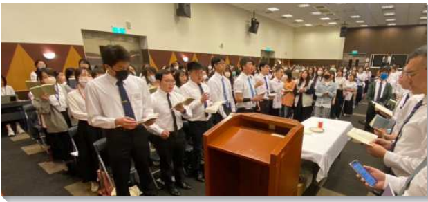
▲文山二、三大區暑期學生特會

就會過什麼樣的生活。但是，弟兄們鄭重的題醒學生們，這世界上所有的標竿，對主而言，都是青年人的私慾，沒有價值。基督徒的標竿，是要贏得『基督』！沒有主作標竿的人，就容易隨流失去，我們需要花力氣拒絕世代下坡、日漸敗壞的潮流。