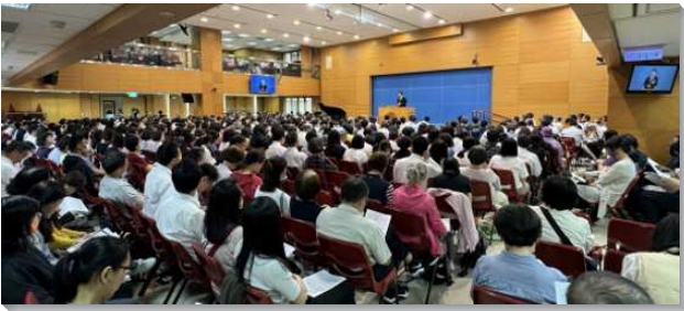
▲ 全台兒童服事研討交通在台中舉行

本次信息主題為『走出去傳兒童福音，家打開得一萬兒童』，其中兩個關鍵詞是『走出去』及『家打開』。弟兄給我們看見，傳福音是神給我們最大的使命，倪弟兄甚至說是『惟一的使命』，因此我們每週都需要分別時間，帶著福音的靈走出去。不僅如此，