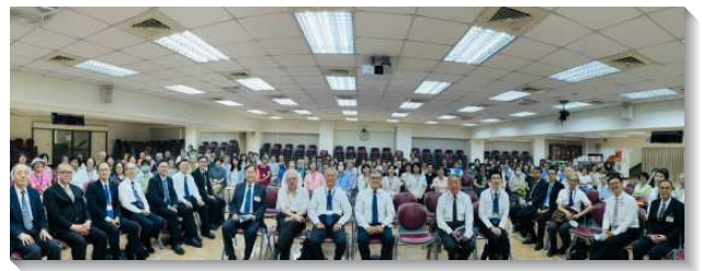
▲城中大同大區週中成全訓練在一會所舉行

關於召會生活的操練，弟兄們非常看重牧養青年人的負擔，因此每週都安排聖徒傳福音及帶人得救的見證。學期中一位姊妹作見證，如何對人有負擔，和活力伴一同為人禱告並接觸人，經過幾個月的牧養帶人得救。新得救的聖徒被牧養在排裏，也開始為家人朋友禱告並傳