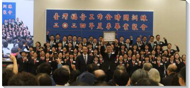
▲全時間訓練畢業學員獲頒畢業證書

詩歌後有學員的蒙恩見證，分為三部分。首先，在職事和真理方面，新約職事的工作，是為著要完成神關於新約經綸之獨一的職事，就是建造召會作基督的身體。藉著訓練的成全，加強學員們對這份獨一新約職事的認定，並藉禱研背講，被構成且能講說這職事，跟上主今時代的行動，完成神的經綸。第二，在生命、性格以及語言方面，操練靈與主有更多交通，突破個性的限制，將天然所是帶進復活裏而顯出功用。在語言的操練上，為著一個新人的交通，突破畏懼，積極操練講說不同語言。第三，在事奉、基督的身體與心志方面，看見傳福音的異象不僅是為著拯救靈魂，更是為著得著神建造的