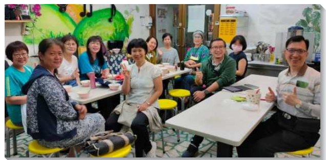
▲聖徒們積極增排人數擴增

讚美主，祂是聽禱告的那一位，第一次的週六排，不僅所排的椅子坐滿人，主還帶領一位到會所附近診所看診的聖徒參加。週六排藉著追求晨興聖言，享受台語和國語詩歌，眾人攜帶茶點相調，週週喜樂的聚集。週六排成立之後，全會所社區聖徒入排比例約為六至七成。我們深信藉著小排生活的牧養與成全，聖徒們更多建造，並被真理所構成。期盼人人入排，有份小排生活的享受與供應，滿了召會生活的實際，並且至終將帶進身體的繁殖與擴增。（王得安）