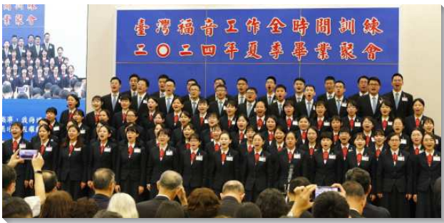
▲聖徒們參加全時間訓練夏季畢業聚會

聚會開頭，教師引用提前四章十五至十六節，勉勵學員持之以恆、堅定持續的操練，直到被主變化。訓練幫助學員建立每天個人禱告、規律讀經的習慣，操練過神人生活，這操練必須帶到畢業後的生活中。教師勸勉學員們實行三個點：第一，每天將自己交給主、愛主，向著神聖的分賜敞開，享受主作殼用的恩典。第二，殷勤讀聖經、讀註解、讀書報，並實行禱告、為人代求、實行申言，將生命供應給聖徒們。第三，實行神命定之路，為此爭戰甚至犧牲，直至被構成，直到主來。