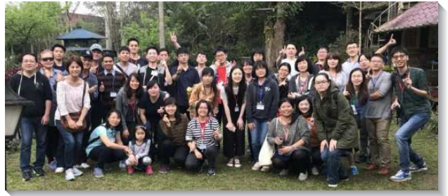
▲青職聖徒有分身軀的交通

我們也恢復了主日豫備聚會，在每個主日早上七時四十五分到八時四十五分，聖徒一同參與。其中青職聖徒佔大多數，從晨興聖言的鳥瞰，週一至週六的三分鐘中