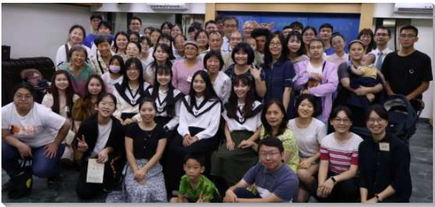
▲聖徒們參加畢業生聚會

這次的畢業聚會主題是『簡·選』，是根據於畢業生所創作的畢業詩歌所訂。詩歌說到：『簡單跟隨，不疑揀選，上好愛情，神聖經綸，定準我心』！畢業