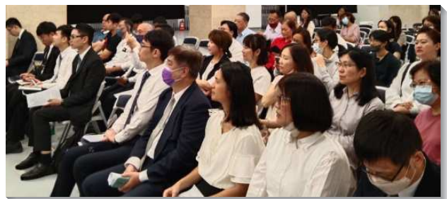
▲聖徒們參加週中成全

第二段分三個班追求：（一）聖經研讀班：帶領聖徒逐章的進入聖經書卷，加強對聖經本文的認識，以扎實的被真理構成；（二）書報班：進入『生命經歷的實際功課』，除了享受信息的生命供應，更落實對長青聖徒的看望與照顧；（三）李常受文集班：進入一九七〇年第二冊，特別在召會生活的實際經歷上得成全，一面看見宗教如何的深植在我們天然的構成裏，一面也加強我