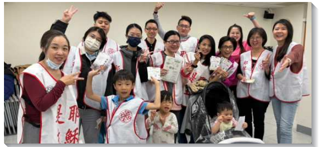
▲聖徒們傳福音結果子

五月時，主祝福祂的召會，聖徒們結了四個果子。這不是我們憑自己所作的，乃是我們操練住在主這葡萄樹上的結果。正如主在約翰十五章五節、七節所