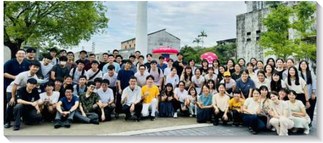
▲大安區大學聖徒期末特會

第三篇信息為『建立操練靈的習慣，將神賜給我們的靈如火挑旺起來』，我們不只要在聚會中主動操練靈禱告，更應該在我們基督徒的生活裏，建立操練靈的習