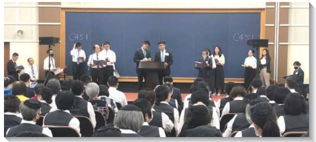
▲聖徒在國殤節禱研背講特會中分享

末了一篇信息為『三一神在基督裏藉著照在我們心裏而作我們的生命』。我們眾人既然以沒有帕子遮蔽的臉，好像鏡子觀看並返照主的榮光，就漸漸變化成為與祂同樣的形像，從榮耀到榮耀，乃是從主靈變化成的