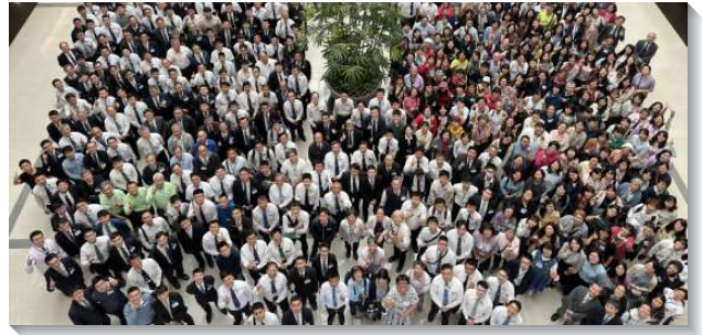
▲聖徒們參加國殤節禱研背講特會

第四篇信息說到『住在基督這真葡萄樹上』。主耶穌說，『我是真葡萄樹』（約十五1上）。作為葡萄樹的枝子，我們需要住在葡萄樹上。我們住在基督裏，使祂也住在我們裏面，乃是藉著顧到包羅萬有之膏油塗抹的內裏教導（約壹二27）。膏油塗抹乃是在我們裏面複合