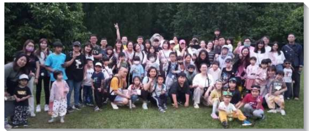
▲聖徒們同心配搭兒童福音行動

爲此聖徒同心配搭從製作名牌、座位安排、兒童排流程、作餅乾細節，以及會後誰負責向誰傳輸見證等等，都一一禱告、交通確定，人人都進到這負擔裏。