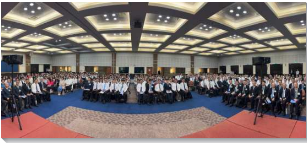
▲國殤節禱研背講特會在中部相調中心舉行

第二篇信息為『接枝的生命』。我們是基督裏的信徒，該過接枝的生活，在這生活中我們與主是一靈，並活在與祂生機的聯結裏（林前六17，約十五4）。我