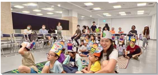
▲聖徒們喜樂參加親子品格園

親子品格園共分三個梯次，每一個梯次約有二十二位兒童參加，家長和服事者約三十位。此次親子品格