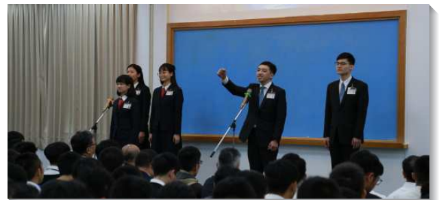
▲全時間訓練學員們分享蒙主呼召見證

此外，教師也交通到，訓練在四方面，幫助我們過經營基督的生活：第一，訓練幫助我們建立起操練靈的堅