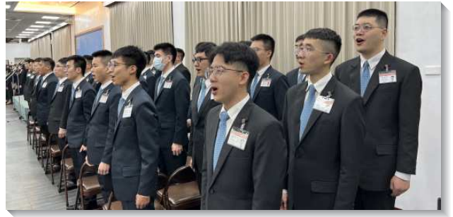
▲全時間訓練學員們展覽詩歌

接著，教師給我們開啓，看見經營基督在基督徒生活中是一件非常重大的事。我們都有這位包羅萬有的基