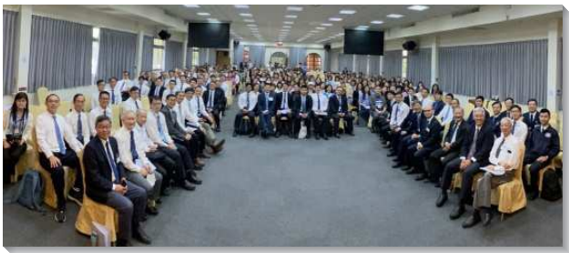
▲大學院校教職員暨服事者相調聚會

兩堂聚會各分為兩組，第一組為現代科技趨勢與大學校園服事，以及大學校園心理健康專題。現代科技日新月異，AI快速崛起，但這不應該成為我們的攔