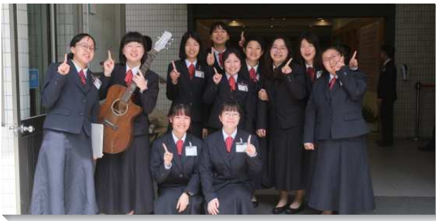
▲全時間學員於訓練中心唱詩歌迎賓

本次呼召聚會的主題為『經營基督，建造身體』。神渴望祂所造的人充分認識祂，經歷祂並在宇宙中活出祂。為著完成神的心意，僅是在埃及享受基督作逾越節的羊羔，或在曠野享受基督作嗎哪是不敷的，只有當祂的子民經歷並享受基督作他們的美地，而在地上建立祂的城—祂國度的中心，以及祂的家—祂居所的中心，神