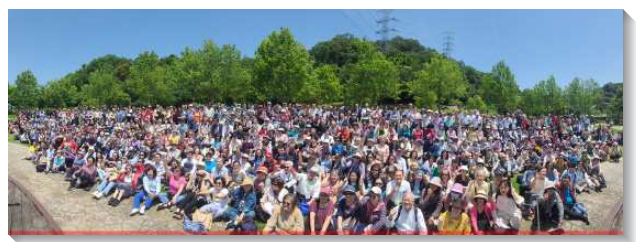
▲生命成全照顧組聖徒相調

弟兄們鼓勵加強眾人，說到主的恢復要往前，第一，我們需要操練我們的靈，呼求主名。第二，不但