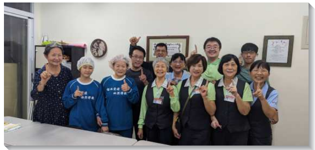
▲學員與聖徒在花蓮傳福音帶人受浸得救

二、學員傳揚高品福音，主話擴長，而且得勝。三、抓住機會，傾倒香膏：有的學員年事已高者、有負傷上陣者、有來自花蓮災區者…皆奮不顧身，抓住機會來刺繡美衣，傾倒香膏全為主。四、基督身體，同被建造：各地召會扶持，聖徒同心開展。各隊結果不同，但在主眼裏美麗如得撒，秀美如耶路撒冷，威武如展開旌旗的軍隊！台北十一會所隊以基督為其人位，同作一個見證