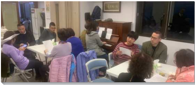
▲聖徒們一同追求生命讀經

三十八會所聖徒看見要學習真理，應該讀恢復本經文連同綱目和註解。除此以外，也該讀生命讀經信息。青年人該劃定每天明確的時間，花費在主的話上。自去年年底開始，本會所為跟上生命讀經追求的水流，在幾個原有小排，開始追求生命讀經。此外，也建立追求的線上群組作為每週進度題醒及分享交通的園地。一段時日後，會所中老練的聖徒發起專特的生命讀經線上分享聚會，排定聖徒負責鳥瞰、總結、