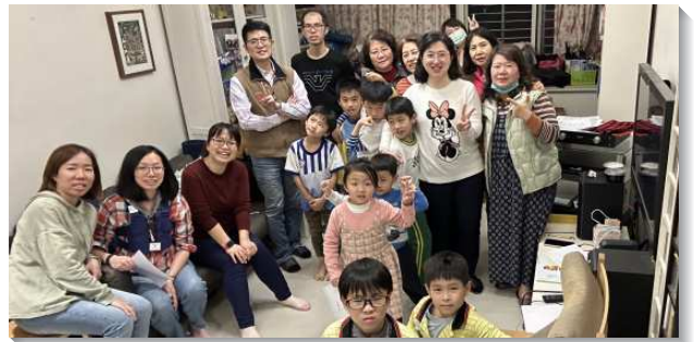
▲聖徒們開家服事兒童排

實行兩年下來，我們幫助鄰近會所成立兒童排，恢復了兩個家，更有近十個福音家庭不定期參加我們的聚集。此外也鼓勵參加青職排的兩個年輕的家（恰巧有四位孩子尚處幼童階段），經過交通後，幾位年輕媽媽於青職排愛筵後，規劃出時間帶孩子唱詩歌、說