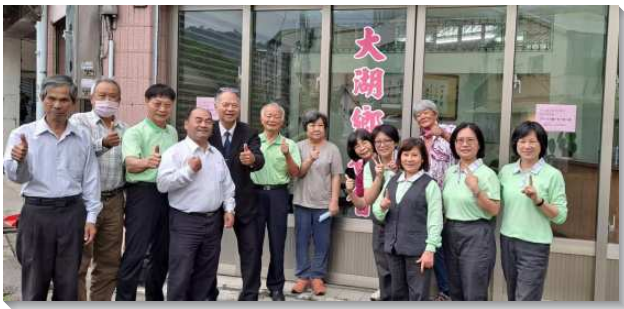
▲學員和聖徒在苗栗大湖開展叩訪

壯 年成全班學員於四月二十三日至二十八日有一週福音開展，學員吹響福音號角，真理旌旗飄揚！三十六隊基督精兵浩蕩起行，福音船開往全台各地。與此同時，氣象報導有連續鋒面來襲，全台暴雨，但讚美主，福音的行動風雨無阻，福音白馬奔騰，福音烈火燒乾滂沱大雨，也燒盡退縮氣餒，代之而起的是基督身體得勝的建造。全體學員在一個靈裏站立得住，同魂與福音的信仰一齊努力，與主前往，無不得勝。王的箭銳利，射中王敵之心，撒但已蒙羞！學員與當地聖徒緊密調在一起，聖靈祝福帶來驚人收成！全台總計二百人受浸，呼求主名達三千人以上，聖徒配搭人次超越以往，高達七千一百一十五次，顯出基督復活繁茂的豐富！