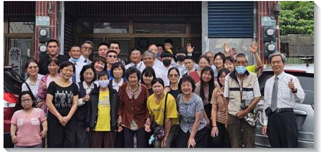
▲聖徒與學員在嘉義六腳鄉配搭傳福音

一、聖靈作工，施恩拯救：學員們腳掌踏遍台澎金馬各地，自生門至熟門，自一百歲人瑞，至得榮少年皆有人受浸，亦有越南、印尼移民浸入主名。台北二十會所一位聖徒為父母禱告多年，返家見學員正為父母施浸，當場喜極而泣，見證『當信靠主耶穌，你和你一家都必得救』。台北四十七會所隊，有人自行按門鈴要求受浸。桃園八德隊有人甫進會所聽見主不變的愛，信基督死而復活，會後受浸。也有身上刺青者因浸衣太小，竟溫順如羊，回車自取衣服來受浸。苗栗大湖隊叩門遇長者不想活，與學員同唱詩歌『耶穌拯救世間人』眼中泛淚，其兒感動學員救父命，父子倆同時浸入父、子、聖靈的名裏。台東隊遇重聽眼花的百歲人瑞，對人生失去盼望，藉不斷大聲呼求主名禱告，遂被喜樂充滿，當下受浸。花蓮隊因花蓮地震，多處道路封閉，馬路福音難傳，福音聚會卻不斷有人受浸，共浸二十人。新北央北