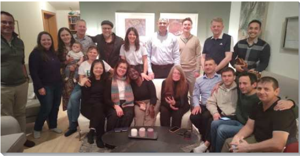
▲ 聖徒們至冰島福音開展

兩個從烏克蘭的家因著俄烏戰爭揀選逃難到冰島，也和我們一起配搭出外傳福音，他們住在首都 Reykjavik，兩家住得很近。每週一晚上他們有職事信息追求，週三晚上有禱告聚會，週中有生機的小排聚會，主日中午有聚會，還沒有擘餅聚會。他們不會說英文，正在學習英文，但是極其樂意一同行動及配搭豫備晚餐。