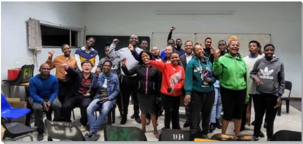
▲史瓦帝尼技術學院校園小排

初到史國時，當地尚無召會生活，我們主要與鄰國南非聖徒線上聚會，後來在聖徒引介下，得知有當地聖徒曾到南非與台灣過召會生活，我們便逐一探望那些聖徒。之後正好有幾位參加南非全時間訓練剛畢業