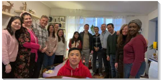
▲ 各地聖徒至冰島傳揚福音

另外一個當地的冰島弟兄在我們去探訪他時說：『若是十年前，沒有人會對這個單張有興趣。但現在正是時候，年輕的一代他們擁有了這個世界可以給他們的一切，但是他們仍然覺得虛空。』我們接觸到另外一位在