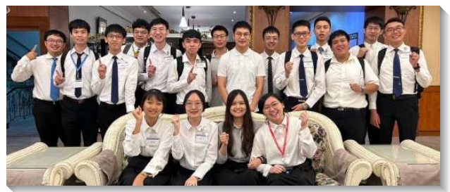
▲陽明交通大學的學生受成全

我們今年主要在兩個點上帶領學生們往前。首先是操練表的實行。操練表的內容主要為三大項，扎根生活、