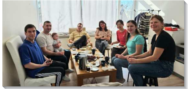
▲ 在冰島的聖徒們一同配搭開展

這次時間因為非常接近復活節的假期，所以學校裏的學生所剩不多。因此我們向主禱告要接觸到一些『關鍵』的人，因此在大學及社區裏，我們都是大量的、各面的發放單張。我們也發送聖經，主要就是去做撒種的工作。有分本次行動的每一個人都能見證，藉著冰島文的『人生的奧祕』，讓我們能以一種特別的方式來接觸冰島人。感謝主！我們遇到許多敞開的平安之子和尋求