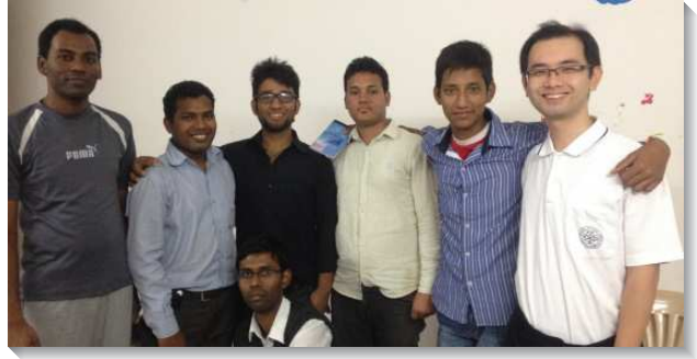
▲聖徒在印度傳福音帶新人得救

我們有時候也像作夢的人，竟然和印度人一起吃飯、起居、晨興禱告、傳福音，一起去買菜。雖然不同膚色，卻同有一個生命，惟有基督是一切，又在一切之內。外國人在此真不容易，單是買東西、搭車都不簡單，狀況不可思