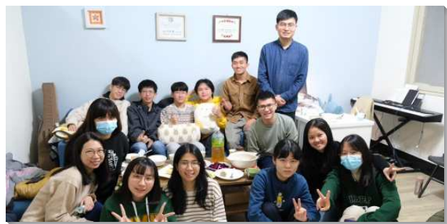
▲北醫畢業聖徒開家照顧學生

第二，加強、豐富夜間擘餅聚會。我們安排初信成全、聖經分享等基礎課程，讓新人能打下根基。且由會所每週愛筵學生供應飯食，學生們可以藉著用餐彼此牧養。此外，在二〇二二年也新增外語生的服事與聚集，因而有許多外籍生與我們一同相調建造。