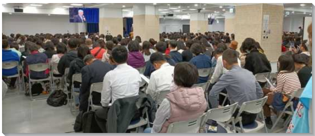
▲聖徒們參加青少年服事者事奉相調聚會

第一篇說到：『認識青少年的價值、特性與世代的情形以得著他們』，在每一個轉移時代的工作上，神都是使用青年人。這個世代是喫、喝、娶、嫁的時代，幾乎沒有人關心神的定旨，人亦被撒但破壞並霸佔。家長們要有受託的感覺，兒女如何，乃是父母的責任，而服事者是家庭和青少年中間的『橋樑』。為著召會永續經