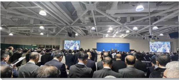
▲春季國際長老訓練在安那翰水流職事站舉行

在聖經中三提書是很特別的，提摩太前書的主題是『神對召會的經綸』，提摩太後書的主題是『對召會敗落的豫防劑』，提多書的主題是『召會秩序的維