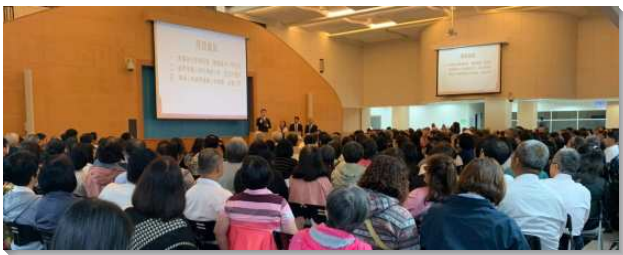
▲ 全台得榮少年關懷者相調聚會在台中舉行

兩場聚會開頭，分別由兩位弟兄以錄影傳輸負擔的話。得榮少年教育專案經過全台眾召會兩年多的經營，目前有一千八百二十二位得少和一千三百三十五個家庭，在眾召會的照顧中。爲了有新的突破，弟兄勉勵眾人『愛有效能』、『有愛就有方法』。他鼓勵關懷者要以人爲導向，肯花時間爲得榮少年規劃有享受的主日聚