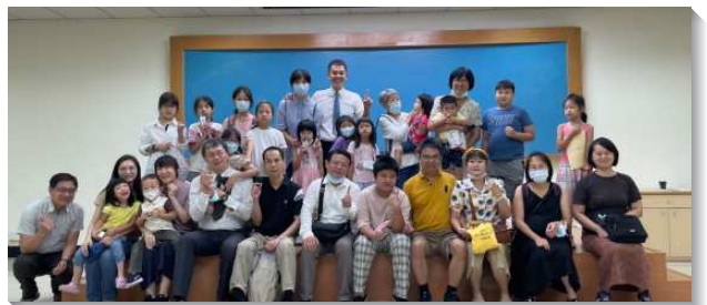
▲ 聖徒們積極擴展兒童福音

願主得著更多的聖徒能爲著兒童工作的興起禱告，並願意將家打開配搭兒童排，藉著兒童福音將救恩擴展到更多年輕的家裏。盼望今年五月後，就陸續有兒童的家長得救，使召會得著繁殖與擴增。（張銘峰）