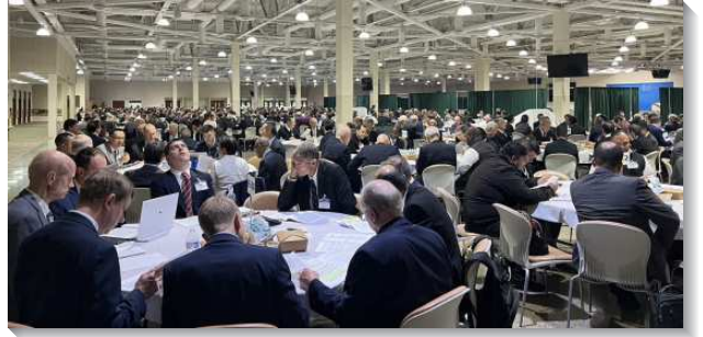
▲各地弟兄們參加春季國際長老暨負責弟兄訓練

本次信息共有八篇。第一篇根據提後一章六至七節，鼓勵我們『建立操練靈的習慣，將神賜給我們的靈如火挑旺起來，藉此活在神永遠經綸的實際裏，以完成這經綸。』第二篇根據提後一章九節，給我們看見『神按著祂自己的定旨召了我們』。我們必須認識並實行神的旨意，好過一種完成神永遠定旨的生活。第三篇根據提後二章，給我們看見為著防止召會的敗落，需要有預防者，我們必須『在基督耶穌裏的恩典上得著加力，成為教師、精兵、競賽者、農夫和工人』。