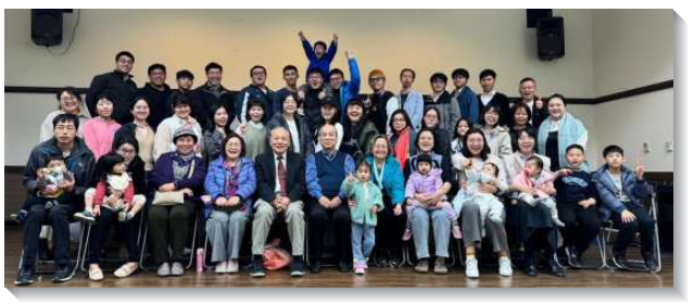
▲聖徒們享受主並供應人基督

求主繼續祝福，人人都投入週間的召會生活，增組增排增區不間斷，使基督的身體得以擴展。（林子柔）