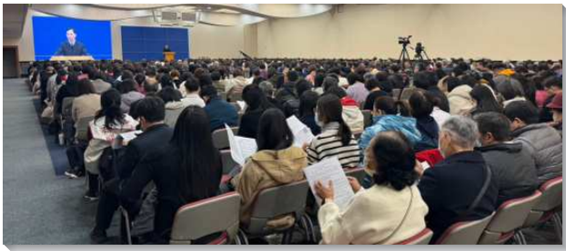
▲ 兒童服事者事奉相調聚會在信基大樓舉行

本次信息主題為『開家實行兒童排，實現『兒童是一個大的福音』，使召會得擴增並年輕化』。關於『兒童是一個大的福音』的異象，我們需要看見兒童對於召會的擴增是極其關鍵的，因為他們能擴增無限，而成為難以想像之繁增的『福音種子』，這會打開許多家庭及每一所校園的門。兒童不只能帶兒童，也能帶進未信主的家庭，而得救的兒童更能逐步成為各校園中的福音種子。因此各地負責弟兄以及同工們都要看見，兒童工作在神這個大家庭裏的重要性，長老們一定要帶全召會接受負擔，注意兒童工作，集中全力的作。