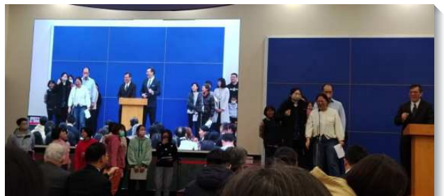
▲ 聖徒們在兒童服事相調聚會中分享

弟兄們交通要以四月作開家兒童福音月，期盼負責弟兄帶頭作榜樣，吹號並鼓勵聖徒一同配搭。盼望開排數超過三百一十五排，參加過兒童排的人數破三千。現場收到共四百四十二張心願單，其中一百三十七位已開排，還有二百三十四位願意體驗開家，更有四百二十五位願意響應領受『兒童是一個大的福音』的負擔。