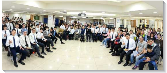
▲聖徒們積極熱切傳福音

我們還設立福音開展的群組，並且製作傳福音時間表，表格裏有集合地點、集合時間、與開展的校園。這