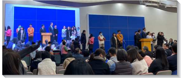
▲ 聖徒們在兒童服事相調聚會中見證

一對經營餐飲業的聖徒夫婦，運用店面空間每個月作一次英文兒童排，會所裏不同小區的聖徒前來輪流配