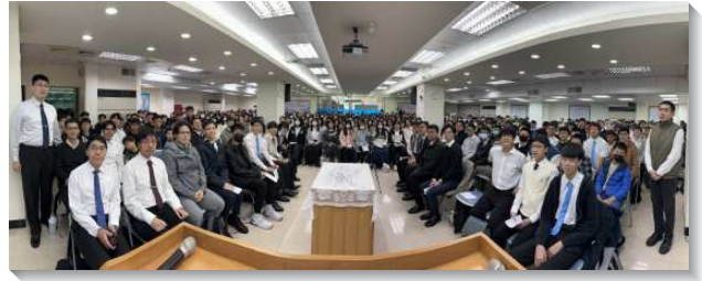
▲文山二、三大區大學期初特會

一位兒童班弟兄見證，他在高中時期沉迷影音平台與社群，內心漸感虛空，行爲也出現偏差。但他試著