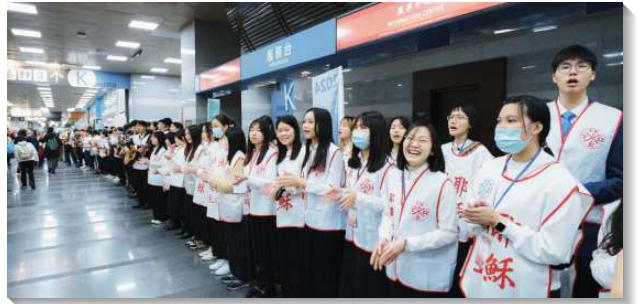
▲青年聖徒在會場門口以四國語言唱詩迎賓

爲著製作十一日主日擘餅聚會給全球眾聖徒所擘的餅，北市大安大區的弟兄姊妹們從特會開始的數個月前就在三會所親手建窯，將窯及製餅的大型圓形模具搭建起來，試著多次烤製直徑有一米二的大餅，最後在特會開始之前兩週試作成功。在十一日凌晨，作餅服事的弟兄姊妹們從同心合意的禱告開始，經過各個不同角度翻面烘烤之後，大餅製作成功！在眾聖徒的禱告及祝福中所製作出來的大餅，小心運送至會場，呈獻到台前，過程相當不容易。因著有弟兄姊妹們在過程中禱告和祝福的堆加，讓三萬五千人在擘餅聚會中，一起唱著：