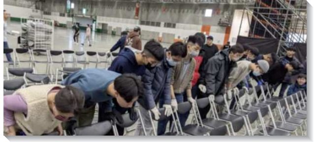
▲五百位聖徒在會場佈置三萬多張椅子

二月十日早晨，有來自北市及新北市召會的青年人，在走廊列隊整齊，爲這兩天特會迎接聖徒及傳遞餅杯的服事再有禱告及排練。因著本次特會參與人數較六年前增多五千位，許多青年人看見服事的需要，首次加入國際華語相調特會的招待及餅杯服事。面對服事過程中可能面臨的突發狀況，也操練在靈裏服事，經歷到：不倚靠自己，乃是『交出自己、信託身體、靠主權能得加力！』在這兩天的特會，當各國聖徒們看見一班清心愛主的青年人在會場門口，熟練的以四國語言唱起詩歌讚