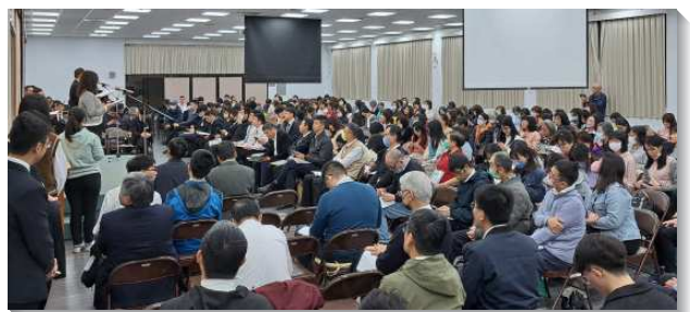
▲大安區冬季現場訓練在三會所舉行

每堂會後的分享與信息的複習亦是非常寶貴，特別是在這次的訓練中，有許多近年進入召會生活的新面孔加入，一同進入主話。盼望主藉著訓練的信息，定準並保守眾聖徒，都看見並經歷基督作一切，將所經營的基督獻上，成為神與人共同的滿足！（畢凱歲）