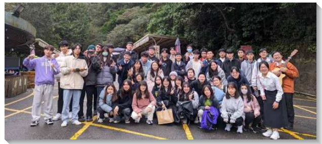
▲城中、大同大區六所大學期末特會

學生們在特會前、後有許多相調，雖然跨大區、跨會所，也能彼此作同伴！提後二章二十二節說：『你要逃避青年人的私慾，同那清心呼求主的人，竭力追求公義、信、愛、和平。』青年人所需要的就是找著清心呼求主的同伴，一同竭力追求公義、信、愛、和平，而其