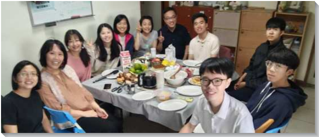
▲聖徒們邀請福音朋友用餐

『當我們在基督的身體裏，我們實際上不是在進行屬靈的爭戰，乃是在享受屬靈的爭戰。我們不是在奮鬥苦戰，反而爭戰成了一種享受。』（以弗所生命讀經，第九十七篇。）當我們交通到要突破福音，主引導我們該加強守望禱告以從事屬靈的爭戰，所以我們