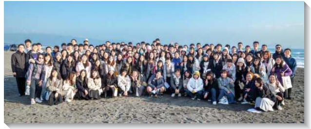
▲大安、城中、信基大區大學期末特會

第一篇信息『一個在神計畫中的青年人』，說到人是神計畫的中心，神乃是呼召青年人來轉移時代，祂正等候有人與祂合作，盼望學生們能過與同伴追求主話的生活。第二篇『掃羅的出生與宗教』，說到我們需要的不是宗教形式、教訓和知識，乃是對基督有活的認識，負擔是學生們能在異象中看見基督並追求基督。第三篇信息『掃羅的生活與悔改』說到，宗教和傳統與基督和基督的啓示相對，我們需要悔改，轉向基督自己，因為神