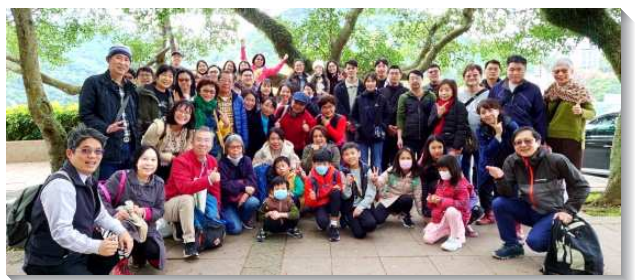
▲聖徒們同過喜樂甜美的召會生活

青職的弟兄姊妹互相作同伴，追求主話、一起服事配搭，滿有生命的湧流。本會所推薦參加訓練的六位學員，都很得訓練的幫助，生命長大、對主的經歷加多，在福音及牧養上更是竭力。是眾人的喜樂！願主加強我們更加同心合意，一起愛主、愛祂的召會。（廖英智）