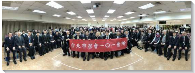
▲一〇一會所於二〇二四年一月二十一日成立

到了下半年，我們藉著在路口傳揚福音，加強接觸青年人；也藉著增排穩固新人，並帶進主日見證。各