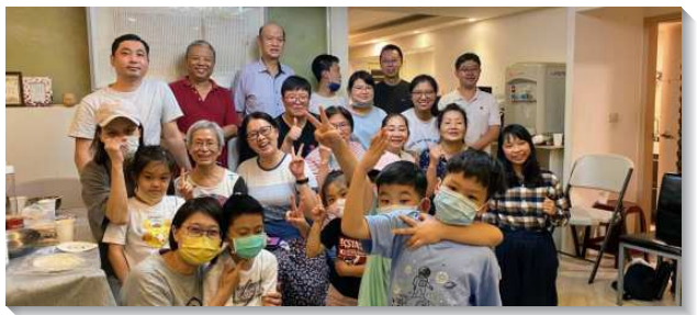
▲聖徒配搭服事兒童排

會所中服事照顧年輕人的聖徒，目前也開始尋求要有系統的成全家長及青少年服事者們，這也是本會所兒童排需要繼續代禱及突破的部分。感謝主，因著恢復兒童排，使全會所從最小到至大的聖徒都活了起來。盼望藉著得著屬靈的下一代，讓一個一個穩定的家被興起來，成為建造召會的柱子。 (唐婉庭)