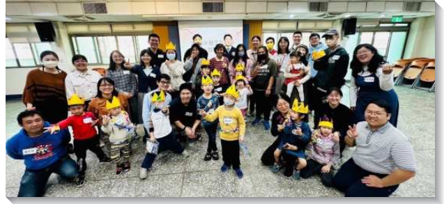
▲訓練學員至全台與聖徒配搭開展

高雄新荅獅甲隊的學員剛到新盛會所的第一件事，就是在門口屈膝禱告，這給聖徒深刻的印象。然而開展過程中，學員裏面的軟弱與不足被暴露，配搭上有了難處。藉著個人每日與主來往交通，加上教師話語的幫助，就在身體裏過了配搭的關，能來在一起屈膝，迫切禱告。林前十二章二十四節說，『但神將這身體