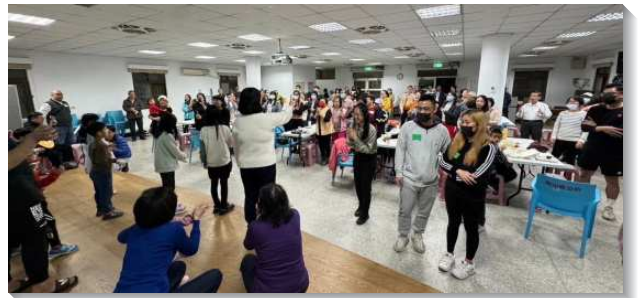
▲全時間訓練學員至各地開展傳福音

台中西屯開展隊在末了一週，經歷在生命和愛裏與聖徒交接福音牧養名單。經過與隊長和負責弟兄同心齊力的交通下，將已過持續牧養的福音朋友，交接給合適的聖徒照顧家。甚至興起大專生與青職願意出代價承接牧養人的託付，分別時間一同配搭看望和牧養。見證肢體各盡功用，人人都能作牧養成全的工作。