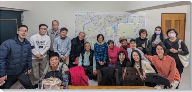
▲全時間訓練學員至全台福音開展

在這五週開展中，學員們操練時時住在主裏面，聯於三一神作源頭，使我們多結果子。本次共有二百零一人相信受浸，八百一十六位有分家聚會，累積至第五週帶人參加主日達一百一十五位，有一百二十四位入排，成立十五個排，與一個區。與去年相比，今年各地召會聖徒更加踴躍配搭身體的行動，每週約有三千四百二十位聖徒一同出外接觸人。以下列舉幾處蒙恩。