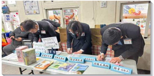
▲全時間訓練學員配搭推廣書報

這十天中，我們也操練不住的禱告。無論是出發前、車程中，和在叩訪的前後都學習禱告主，並求主在每一個受叩訪的對象裏來動工。我們越禱告也就越喜樂，無論書報銷售的情形如何，我們都能經歷在主裏面喜樂，因為在我們裏面的三一神乃是喜樂的神。末了，我們也能見證主實在是信實的，祂親自使我們遇見許多渴慕主話的人。在一次的叩訪中，我們看到一家不在名單上的店面，便上前拜訪。老闆娘很熱情的招待學員們，且在當天就購買了十本好書，並歡迎我們之後若是路過店面可以再進去坐坐。