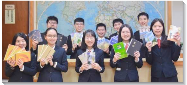
▲全時間訓練學員至全台推廣書報

在推廣的過程中，我們看見無法單獨，要在配搭中來推廣，將主的話清楚且完整的向人陳明，過程也相當的甜美。許多弟兄姊妹都經歷羅馬書十二章四至五節所說，『正如我們一個身體上有好些肢體，但肢體不都有一樣的功用；我們這許多人，在基督裏是一個身體，並且各個互相作肢體，也是如此。』在身體裏，每一個肢體都有不同的功用，有些人負責傳講、有些人熱情接待、有些人殷勤且細心的服事。我們都能見證，身體上的每個肢體都是不可少的。我們也和當地聖徒聯繫並邀請他們一同配搭。在叩訪會堂時，他們會先幫我們和各