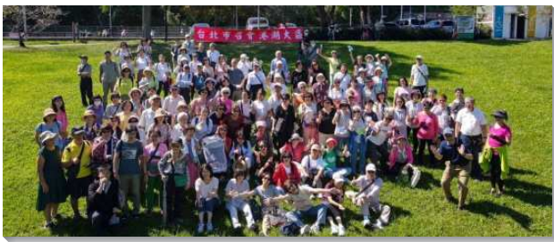
▲各大區聖徒參加成全照顧組相調

三個會所聖徒參加。士林大區十個會所有一百一十多位聖徒，搭乘三部遊覽車延著三個路線前往。港湖大區九個會所的聖徒搭乘三輛遊覽車。一個多鐘頭的車程中，大家唱著詩歌，感受神的愛使我們相聚一起，愛使我們建造一起，永遠的愛就是神自己，這愛是在基督耶穌裏。這真是年長弟兄姊妹們的經歷與見證！