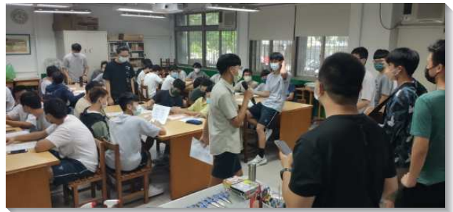
▲建中學生們在校園中傳揚福音

十二會所青職聖徒積極相調。不僅在傳福音上，也在青職小排聚會上有了具體的負擔與行動。藉此，青職聖徒們週週外出傳福音，小排聚會週週豫備一篇生命讀經的信息摘要與問答，一同進入創世記生命讀經的享受。至今已有兩位青職受浸得救！