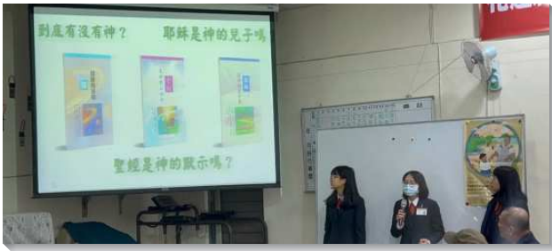
▲全時間訓練學員推廣真理書報

經過這次的書報推廣，學員們更認定且渴慕被新約的職事所構成。推廣期間，我們看見各會堂弟兄姊妹非常愛主，有人甚至甘願為主花費一生的時間來服事人。另一方面，我們也看見許多會堂仍需主話的供應。有一次，我們參加一個會堂的查經聚會，查讀路加福音二章一到