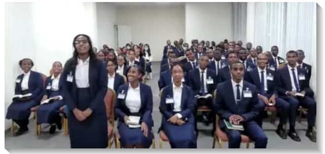
▲阿迪斯阿貝巴全時間訓練中心畢業聚會

在現場共有八十位聖徒一同有分聚集，另也藉著線上直播使海內外各地約兩百位的聖徒都能有分畢業聚