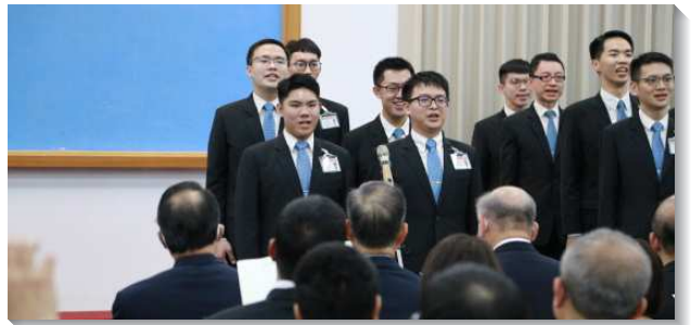
▲全時間畢業學員展覽詩歌及見證

學員們感謝家人、父老與聖徒的扶持、鼓勵，以及榜樣的激勵。感謝同伴們，在變動中擔負彼此，並在各樣的關口上藉著禱告一同突破。感謝教師與輔訓，在這兩年間不計代價的服事與陪伴，從他們的交通中學員們得著生命的供應，事奉主的心志也一再被加強。有兩位學員的家長為參訓的兒女作見證，在訓練裏接受各面的成全，在真理上有裝備，在生命有長進。當家人有需要時，能隨時供應基督，將所經歷並享受的基督跟家人分享並一同禱告。學員服事度量也被擴大，有身體的眼光，願意否認己順服身體一切的交通。