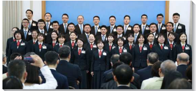
▲畢業學員展覽兩首詩歌

學員的蒙恩見證分為三部分。第一，在職事和真理方面，看見這獨一職事的工作，就是建造基督的身體，藉著成全聖徒而完成。藉著主的話而受異象的管治，蒙保守在神經綸的中心線上，也挑旺他們對新郎主耶穌的愛，因此願意一生藉著禱、研、背、講被神聖的真理構成，接受管家職分的託付，執行神聖的經綸！第二，在生命、性格以及語言方面，藉著望斷以及於耶穌，脫離內顧自己，深願不在天然的生命裏，完全在復活裏用我們所有、所得著的一切幹才，在生命中作王，被作成穩固能承接託付的人。在語言上，在一個新人的交通裏，