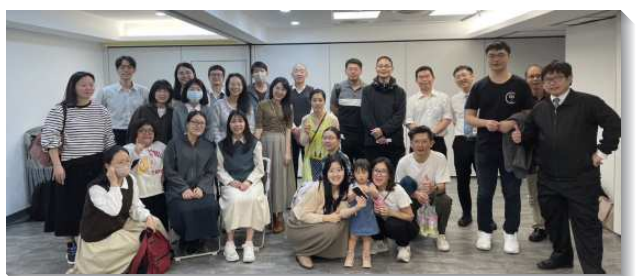
▲青職聖徒們一同出外傳福音

讚美主，不僅如此，因著經過了近一年的調和，三個會所的青職聖徒非常同心，調整原先各會所不同進度之生命讀經追求，進度一致，並彼此配搭製作信息，供給三個會所的青職使用，甚至給社區各小排聖徒追求。我們深信，藉著這樣的配搭，聖徒要以二十年共同追求生命讀經的心願，將更容易達成；並要經歷使徒行傳六章七節所說『神的話擴長起來，在耶路撒冷門徒的數目大為繁增』，榮耀歸神。（羅仲基）