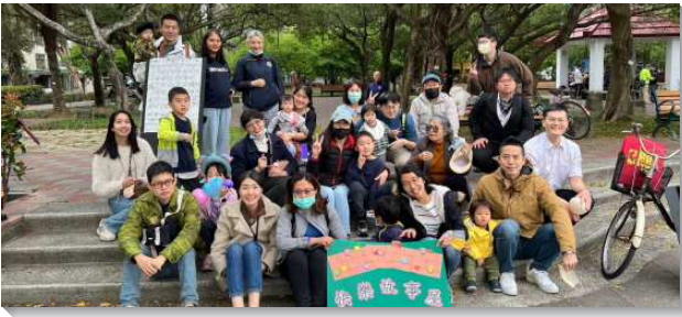
▲聖徒們至公園配搭兒童福音

自去年八月開始，本會所為跟隨台北市召會的帶領，鼓勵弟兄姊妹在週間透過線上共同追求、活力排或是家聚會的方式，每週讀兩篇羅馬書生命讀經。主日夜間擘餅後的真理成全聚會，則調整為豫先鳥瞰要來一週生命