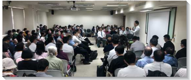
▲ 全台兒童服事者暨家長交通在新竹仁愛會所舉行

為了讓兒童服事者、家長及對兒童有負擔的聖徒，更實際的配搭，服事團分：『送會到家、開兒童排、福音開拓、小五小六交接』，四個組別，讓弟兄姊妹有更深入的交通。一、送會到家：除了在生活中持續接觸送會的家，每次掌握在半小時內，此外，還需建立會後會，幫助兒童家長喫到主的話，找到同伴。二、開兒童排：