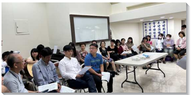
▲聖徒們追求生命讀經並帶人得救

爲響應信基大區十一月十九日青職日，並鼓勵青職聖徒參加訓練中心的呼召聚會，有兩位青職聖徒上台報號願意參加全時間訓練。此外，有超過一半的聖徒