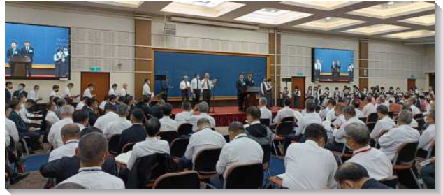
▲ 聖徒們參加感恩節特會暨禱研背講聚會

第四篇信息是『認識包羅萬有的基督並以神的增長而長大』。在歌羅西書中有許多重要的辭句指向我們