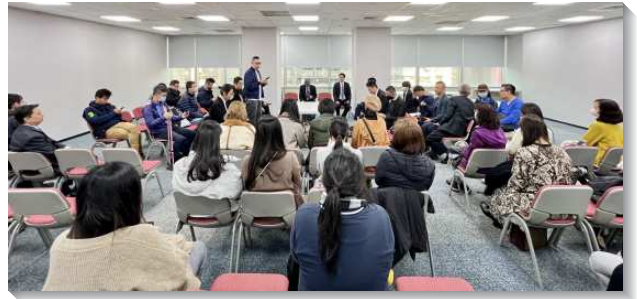
▲聖徒們一同追求生命讀經

第三，會所提供各區Zoom帳號，並以區爲單位，聖徒們每日定時上線一同追求。從九月八日起，建立天天追求、享受主話的習慣，並且要以『共同追求』的方式才能堅定持續實行得長久。