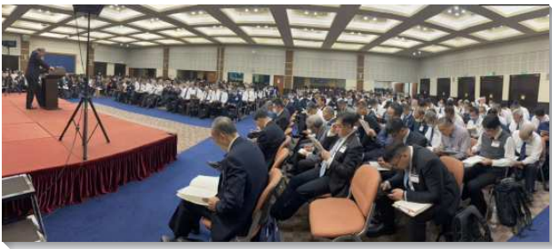
▲ 感恩節特會暨禱研背講在中部相調中心舉行

第一、二篇信息陳明享受基督的負擔。第一篇信息是『享受包羅萬有的基督是召會一切難處的惟一解答』。哥林多前書是一卷論到享受包羅萬有之基督是召會一切難處惟一解答的書。我們該專注於基督，以祂為神所指定我們惟一的中心，不該專注於祂以外的任何人事物。神信實的呼召我們進入對祂兒子的享受，但許多時候我們並不忠信。我們雖然不忠信，神卻是信實的。神信實的允許我們有難處，使我們學習不依靠自己，只依靠祂，並使我們享受基督。哥林多前書啓示，享受主的路乃是愛祂（二九~10），並彼此相愛（十三1~8上）。