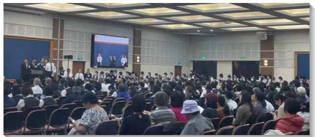
▲ 聖徒們於感恩節特會聚會中分享

第五、六篇信息則是說明生命成熟與豫備新婦。第五篇信息是『約瑟一生中所見成熟生命掌權的一面』。約瑟代表成熟的以色列掌權的一面，就是基督構成在雅各成熟的性情裏。約瑟一生的記載乃是那靈管治的啓示，因著那靈的管治乃是成熟聖徒掌權的一面。約瑟因著受苦並否認己，得了生命供應的豐富。賜給約瑟之宇宙的福，終極完成於新天新地裏的新耶路撒冷，其中一切都是新的，作基督和祂信徒的福。