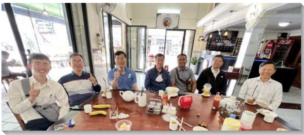
▲ 聖徒們參加全國相調特會

語言的學習算是開展頭半年的重中之重。前面有位弟兄說，『語言不行，寸步難行。』感謝主，我們勉強把高棉語學起來了。而過程中同時經歷了驕傲與灰心。驕傲在於有些人會誇獎我的發音很清楚；灰心在於，其實大家講的我大部分還是聽不懂，跟不上。我