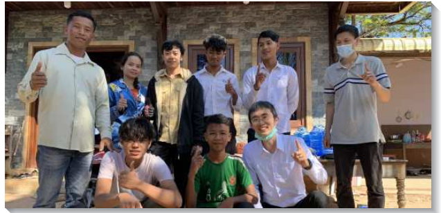
▲ 聖徒們帶人受浸信主

今年新增的詩梳風召會，是由聖靈差遣的兩位弟兄，以每週半移民的模式，在當地恢復了一個關鍵的家，並找著鄰近的弟兄姊妹和朋友，所建立起來的。要來新的一年，我們豫備要恢復馬德望眾召會的見