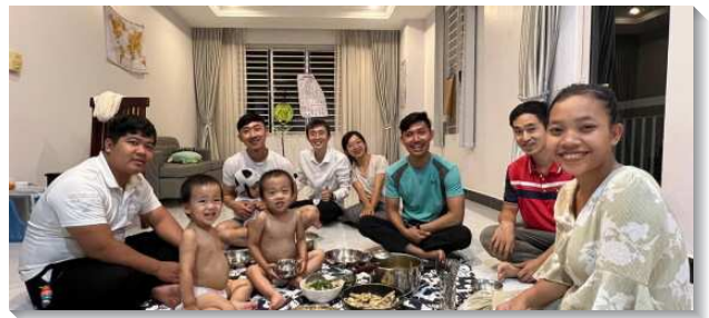
▲ 聖徒陪新人家聚會

主不僅打發工人出去建立召會，也藉著環境把門徒分散出去。短短不到一年的時間，本地召會經歷許多變動。因應為數不少的家即將搬遷到政府為他們規劃的新地區（女王宮縣），我們一面為他們的移民多有禱告，一面在本地也作了區、排的調整，盼望成全更多聖徒起來盡功用服事。藉著在生活中的看望和相調，一些弟兄姊妹開始對親友、鄰舍產生福音的負擔，願意陪我們或帶著我們去傳福音。目前急切的需要，是產生更多的活力排，並在固定的時間建立福和家的架構。此外，盼望每個活力排的活力不是來自我們的文化或天然的熱心，乃是來自這分職事的供應，以及眾聖徒的禱告祈求。