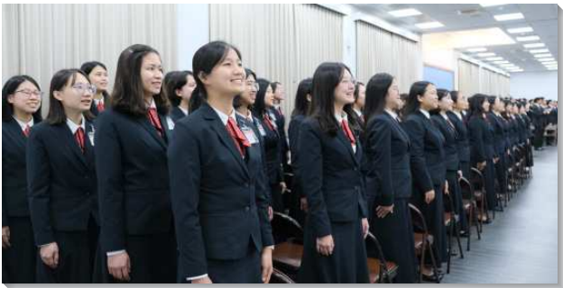
▲全時間訓練家長開放日在三會所舉行

首站來到學員的寢室，學員們分享平時整理寢室內務的過程，幫助他們建立良好的性格。接著學員們為眾人導覽美麗的天空花園，並介紹時光走廊、歷史資料館與海外開展展覽館，讓家長們認識訓練的歷史沿革，也看見學員們在這裏不但過著規律、嚴謹的生活，更在各方面都受成全，好作主合用的器皿。