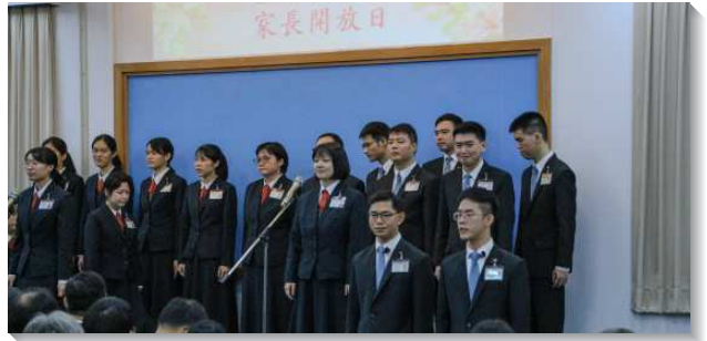
▲訓練學員向家人表達感謝及祝福

隨後，再有四位學員見證他們入訓後的改變。原先個性害羞內向的弟兄，現在能喜樂的與人分享神的祝福。不善於利用時間的姊妹，見證操練時間表所帶來的益處。還有在服事上缺乏喜樂的弟兄，現今能以作