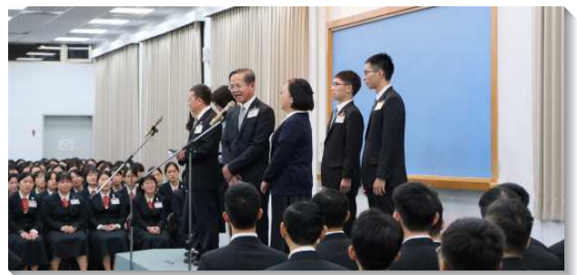
▲全時間訓練學員的家長見證

接著，有兩對學員的父母上台見證他們對全時間訓練的肯定。一面，家長們回想自己年輕時參加訓練所受的成全，對於往後一生受益無窮。另一面，身為家長，他們也會為著兒女的前途多有考慮，但他們更確信訓練所帶給每位受訓者的益處是無價的，因而鼓勵兒女們畢業後要奉獻先參訓，並且呼籲在座的家長們，繼續作學員們最堅強的後盾。