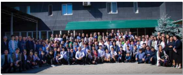
▲中亞相調特會在吉爾吉斯比什凱克舉行

自一九九七年起就有弟兄們受差到中亞訪問並幫助聖徒們有錄影訓練。聖徒們因著職事的話語，認識神的經綸，甚至離棄傳統宗教，忍受親友的逼迫和反