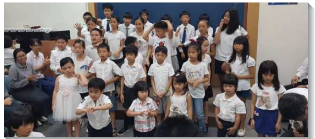
▲聖徒們配搭服事兒童

一開始，本會所有四位老練的姊妹天天一同交通禱告，尋找出年輕媽媽們的名單。再以活力排的方式一同前往看望年輕媽媽，顧到她們屬靈的需要，也顧到她們陪伴兒女之親子時光的需要。餵養一段時間後，