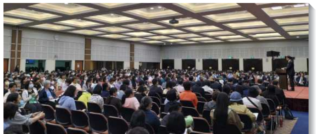
▲全台姊妹參加事奉相調聚會

在專題交通中，有許多姊妹們作美好的見證，藉著禱告，姊妹們盡功用並與活力同伴有活力的事奉，牧養人而與神同工，藉著家打開傳福音且餵養青年人，在各校園接觸年輕人，關心下一代，不論是青少年、大專還是青職。盼與會的姊妹們在年底前帶一人得救，主動拿起負擔，帶進召會福音的開展。