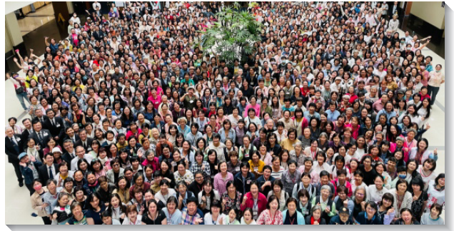
▲全台各地姊妹們參加事奉相調聚會

第五篇則說到，『在神的家中當怎樣行—操練自己以至於敬虔』。我們在召會生活中行事為人的路，就是操練自己以至於敬虔，我們都必須操練我們的靈，因為神的奧祕乃是在於我們的靈，操練自己以至於敬虔，就是操練我們的靈，在日常生活中活基督，以建造召會作基督的身體。第六篇說到『基督的好執事』。基督的好執