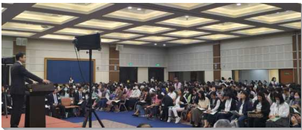
▲全台姊妹事奉相調聚會在中部相調中心舉行

第一篇信息說到『按照神經綸的屬天異象生活並事奉』。弟兄題醒，當我們領受了神經綸的異象時，需要有更多的禱告，不讓這異象輕易的過去，才能進一步影響我們的生活和事奉。第二篇是『可稱頌之神榮耀的福音』。說到榮耀是神的彰顯，就是輝煌的彰顯出來的神。希伯來書一章三節說基督是神榮耀的光輝，是神本質的印象。因此基督的福音，就是祂的榮耀照明並照耀的福音，這福音首先照在我們裏面，然後從我們裏面照耀出去。我們先向福音敞開，遇見這位榮耀的基督，出