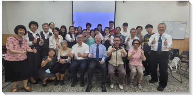
▲壯年班學員至斗六與聖徒配搭開展

二、同心合意的配搭，傳身體的福音：開展前及開展中有多位學員確診，眾人禱告爭戰，學員待身體康復後立即歸隊一同爭戰。學員互相珍賞彼此在身體裏的功用，受十字架的對付，和諧配搭，沒有意見，互相幫