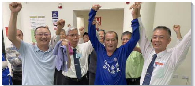
▲壯年班學員與聖徒配搭帶人受浸

四、生命度量擴大，經歷福音的衝擊力：學員因著一週福音開展，更加放膽傳揚福音，有些學員原本體力來不及，主卻奇妙的將人帶到他身邊。有的學員經歷聖靈的充溢，放膽順暢的傳福音信息，並且大有能力，叫人願意起來受浸。有的大聲宣告基督得勝、撒但蒙羞、耶穌是主，主果然將人擄來賜給召會。眾人展覽基督、見證基督，傳福音報喜信的人，腳蹤是何等佳美！