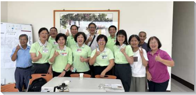
▲壯年班學員至嘉義與聖徒配搭傳福音

學員們藉著福音課程及教師的成全，領受了福音的負擔，對人的靈魂滿了迫切。帶人得救惟一的路就是禱告、禱告、再禱告。為人禱告、為自己的攔阻認罪禱告、與身體同心合意禱告，使學員們被靈充滿並領受聖