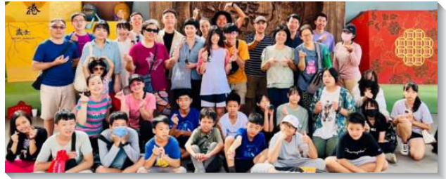
▲聖徒們服事陪伴青少年同過召會生活

青少年區也加強相調的活動，不只於主日下午有室內及戶外各樣的活動，在連續假期也安排跨夜的外出相調。藉著相調，把更多的青少年及家長調到召會生