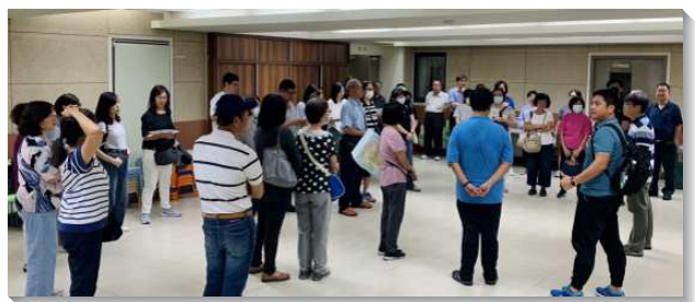
▲聖徒們配搭出外傳福音

最喜樂的是，藉由馬路福音的操練，眾人都活過來了，福音的火也著起來了（路十二49），我們都宣告年底前要帶更多人得救，相信在年底前，聖徒們都能結出常存的果子。（余宏邦）