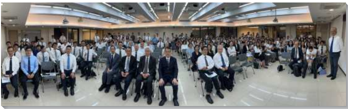
▲一百一十二會所於二〇二三年九月十日成立

已過三年，新冠疫情的蔓延使得聚會從實體場所轉到線上，這不僅減少了聖徒間的互動，也使召會人數增長停滯。儘管如此，弟兄們決意不再受疫情困擾，立定於今年要繁增會所，就於年初的交通展望中提及此意向，得到許多聖徒靈中的響應和禱告扶持。