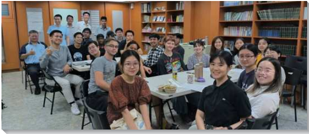
▲ 聖徒與學生們配搭服事外語學生

已過一學期，每週有超過十四位外語生與我們一同聚集享受基督。學期間也舉辦野餐活動、西班牙語日