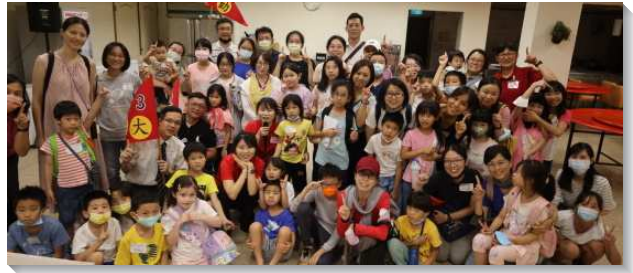
▲城中、大同區親子健康生活園

另外有聖徒介紹地球科學，帶孩子們從神廣大的創造，來認識氣象的變化、地震、甚至太陽系外的諸多星系。這位鋪張諸天，建立地基，造人裏面之靈的耶和