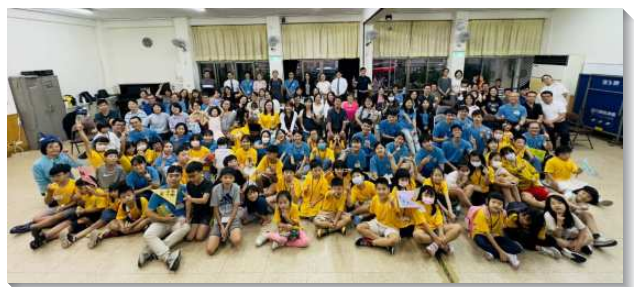
▲大安區親子健康生活園展覽聚會

在親子園展覽當日的家長交通中，不僅有兒童服事同工加強供應，家長們也彼此幫補見證。弟兄說到兒女是看父母的身教，平日在家中的操練很重要。要將兒女們帶到主面前。有家長提及性格操練的確重要，然而整個外在環境都讓家長們更看重兒女於課後時間去加強英文、數學、電腦、鋼琴等才藝，在有限的時間和體力下