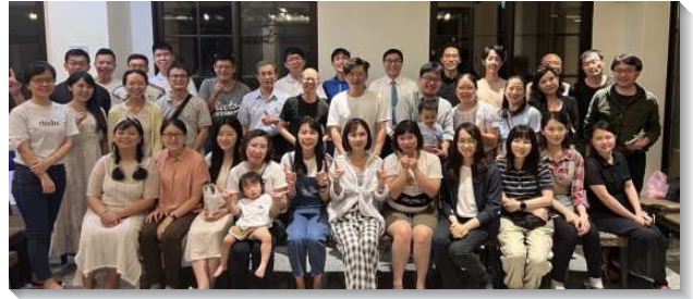
▲青職聖徒領受負擔邀約人

在愛筵過後的福音見證，由青職聖徒拿起負擔，配搭帶詩歌、作見證、帶聚會。一位姊妹見證，因著家中遭逢突變，與母親之間的關係也產生裂痕，人生似已走入谷底，但感謝主，因著福音臨到這家，得救之後，不僅得到宇宙的至寶，使她得著人生的喜樂與滿足。藉著主這和平的聯索，也進而使姊妹與母親的關係重修舊好。一位弟兄見證，原先汲汲營營於工作與事業所帶來成就，卻覺得人生是無比的空虛，不只畏懼工作上無法預料的失敗，即使成功也覺得索然無味。但就在他得救那天，雖然遭逢工作中極大的為難與困境，但藉著不斷的禱告、呼求主名，主那超越人所能理解的平安，保守他的心懷意念，使他有勇氣面對、至終這一切的難處也迎刃而解。