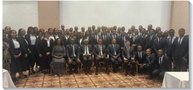
▲阿迪斯阿貝巴全時間訓練畢業聚會

在現場有一百五十位聖徒，海內外各地參加線上直播約兩百位聖徒。聖徒們於會後皆表示深受激勵，更有許多學員的家人因此肯定訓練，進而認識這份職事。畢業學員們也在聚集中更新奉獻，大多數願意跟隨主的帶領而全時間服事。另有學員則奉獻自己，未來無論在職或