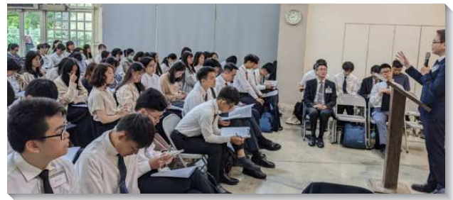
▲大學聖徒參加第一梯次夏季期末特會

第三篇信息說到變化為主建造，當我們接受主作生命，這生命就在我們裏面運行並作變化的工作。這變化不是憑著外面的改良，乃是因著基督在我們裏面的加多。為此，我們需要看見那上好的路，就是喫喝享受