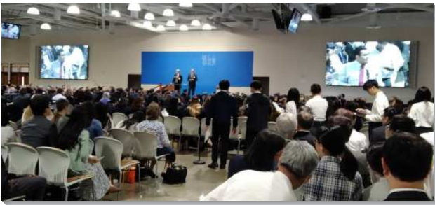
▲七月半年度訓練在加州安那翰水流職事站園區舉行

第二篇是『神聖奧祕的範圍』，三一神自己就是神聖奧祕的範圍，按神格說，是我們無法進入的。我們今天