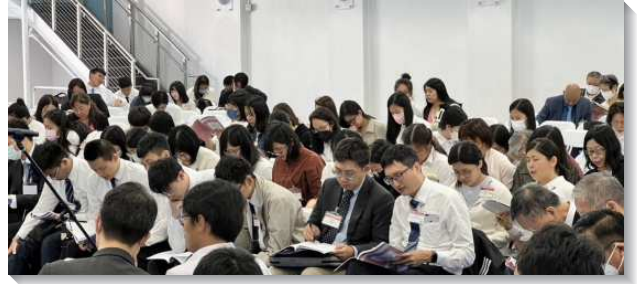
▲聖徒參加七月半年度訓練

第六篇『按著神牧養』記載於彼得前書五章二節，要按著神牧養就需要活神，需要在生命、性情、彰顯和功