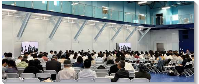
▲各地聖徒赴美參加七月半年度訓練

第九篇『基督在三個時期中豐滿的職事』共完成十件大事。我們要迫切的禱告，要從總括時期往前到加強時