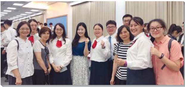
▲青職聖徒參加短期訓練

的重要。教師講到讓生命長大的關鍵在於規律的性格，若沒有規律的性格，生命不會長大。爲了讓基督的生命在我們裏面長大，就需要好好操練性格。在神人生活操練上，每天各有三十分鐘的讀經及個人禱告。藉著這樣的操練，開啓我們對於讀經禱告的胃口和享受。使我們結訓之後，也能每天繼續過讀經禱告的生活。