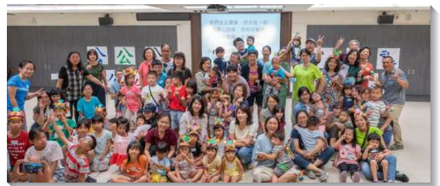
▲聖徒積極配搭傳揚兒童福音

爲此弟兄姊妹決定，公園福音得永續經營，不分春夏秋冬、節令變換，都不能中斷。然而週週在戶外進行相當考驗體力、意志力，每週設計不一樣的課程更是燒腦。感謝主，在這將近兩年的公園福音活動中，