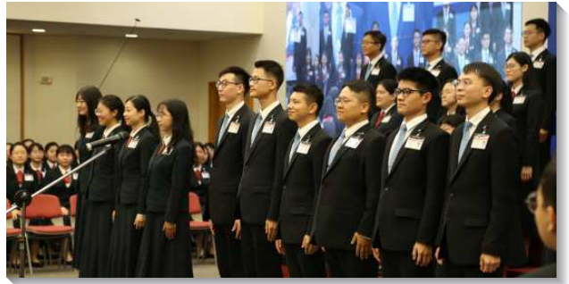
▲全時間訓練學員展覽

領受主牧養的託付，並作忠信的管家，按時分糧。也與各地的聖徒們形成活立排，一同實行神命定之路，將人穩固在召會生活裏。學員們也見證，藉著睽違三年的海外開展，看見基督宇宙的身體和主在全地廣大的需要，而願意出到全地，擴展耶穌的見證。