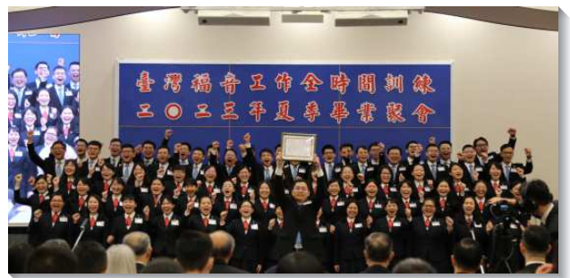
▲全時間訓練學員獲頒畢業證書

末了，教師勸勉學員絕不要忘記，李常受弟兄在一九九五年對安那翰春季全時間訓練畢業學員臨別的話中八個重要的點，並祝福所有的畢業學員，『願主豐富洋溢