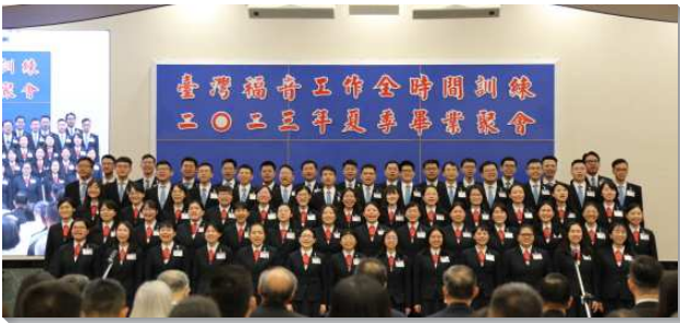
▲全時間訓練夏季畢業聚會在信基大樓舉行

接著學員展覽兩首詩歌，『經歷基督—作生命』說出學員們的態度，無論是在訓練中抑或是畢業後，都要過