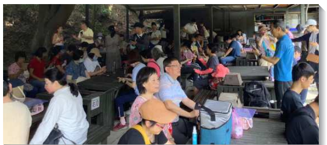
▲聖徒們喜樂外出相調

這次的相調，許多人經歷羅馬書十四章十七節所說，『神的國不在於喫喝，乃在於公義、和平、並聖靈中的喜樂』。主耶穌是我們的真食物，使我們一起喫喝飽足，主的恩典也穀眾人用。感謝主，主的愛使我們眾人相聚一起，滿有聖靈中的喜樂。（巫欣倫）