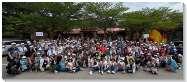
▲生命成全照顧組聖徒們喜樂相調

本次相調對於生命成全照顧組的服事是一項突破。眾人經歷相調除去彼此的區別，調到那靈裏，見證基督身體的一。實際經歷我們是神的兒女，是神家裏的親人，是基督身體上的肢體，彼此相愛，彼此相顧，浸透在主愛裏，榮耀無比。大會後聖徒們都覺得意猶未盡，期待下一次的相調。（生命成全照顧組）