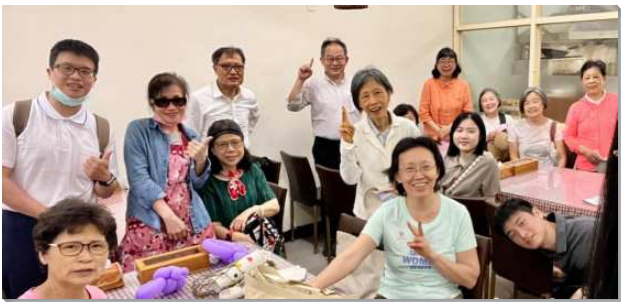
▲聖徒們外出叩訪牧養人

之後按著固定編組回訪區域內對象。藉著分享一首簡短詩歌或經節給敞開的家，將基督供應給他們。盼望藉堅定持續送會到家，不久能於新人或福音朋友的家中建立排聚集，或將他們邀請至現有的小排聚會。如此，藉著繁增小排數或小排人數，就能達到繁增會所的目標。