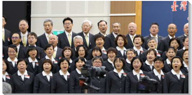
▲壯年成全班學員展覽詩歌

我們跟隨主多年，深覺這一生都該在主訓練的手中，沒有一刻可以離開。學員們分享的這些見證，把保羅在腓立比書三章七至十一節經歷基督的祕訣，活化在眾人眼前。保羅自從在大馬色看見榮耀基督的異象，和基督身體的異象，他整個人生就變得非常積極，迫切追求基督。他以認識我主基督耶穌為至寶，