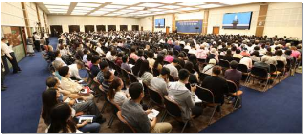
▲壯年成全班暨延伸訓練夏季畢業聚會

聚會開始全體畢業學員合唱『主恢復的獨特』及『讓我愛』兩首詩歌。接著有十六位弟兄姊妹分享畢業蒙恩見證，內容有藉職事的說話得著裝備、生命的經歷與長大、成為聖靈的踏腳石、誇我的軟弱，讓基督的能力覆庇我、主愛困迫，竭力追求、裝備神的話語學習配搭、經歷基督作生命、閱讀聖經，裝備真理、贖回光陰以贏得基督、模成基督之死，不再是我、贖回光陰，湧流生命、靠神大能的話得勝，成為人的祝福、操練否認己，活基督。此外延伸訓練有兩位姊妹分享牧養人和過真正的召會生活。