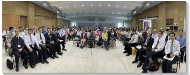
▲城中大同區聖徒參加週中成全

學期間聖徒們前往宜蘭相調，進入課程，使每週在主裏的相聚更別具意義。在戶外彼此交通，見證身體的合一。學期末的展覽聚會，更有聖徒邀約親友同伴共襄盛舉。有聖徒見證，藉著受成全學會接觸人，享受與主同牧養的喜樂。甚或有姊妹見證如何付代價，週週請假參加成全。這激勵與會者現場繳交報名表，有分下學期的成全。讚美神！在眾民面前有恩典，願主藉著聖徒受成全，使召會生活滿了活力，帶進召會的繁增，以達到錫安。（楊子儀）