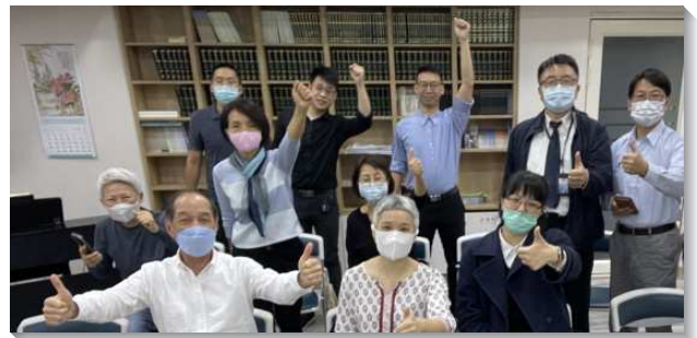
▲聖徒同心禱告外出傳福音

為要開展松山大區，聖徒們週週都在松山區的民有里有福音出訪行動。藉著弟兄姊妹同心合意的禱告，及堅定持續的週週出外傳福音，最近我們得著了一對在其他團體聚會的夫婦。在活力排的牧養與顧惜下，這對夫婦目前有穩定的聚會，對主的話也滿有渴慕。五月起，他們願意將家打開，讓聖徒們到他們家中聚會。這個家將成為在那地福音開展的橋頭堡。感謝主！