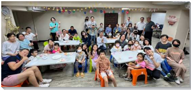
▲聖徒們陪伴兒童及家長參加兒童品格學程

在二月的事奉相調中呼召聖徒們一同配搭，且將眾人編組至幼兒園、國小、公園及馬路各地點發問卷接觸人。一個月之後我們得到近一百份問卷回饋，雖然