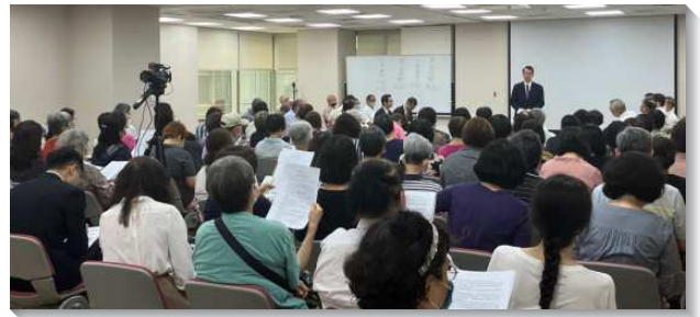
▲信基大區聖徒週中成全

事奉系列主要是幫助聖徒認識『活力排』，信息內容包含幫助聖徒建立活力排，成為有活力的人，並前