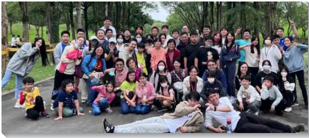
▲ 聖徒們與家長和青少年福音相調

在晚上的福音饗宴，由青少年拿起負擔，配搭帶詩歌、作見證、帶聚會。一位高中生福音朋友，一面見