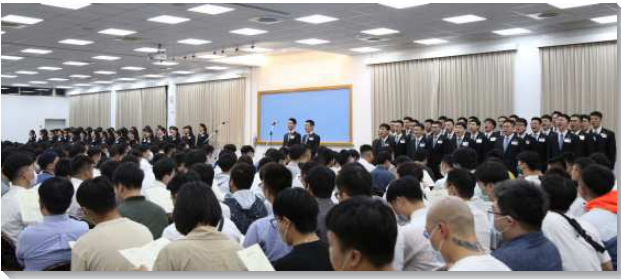
▲全時間訓練呼召聚會在三會所舉行

本次呼召聚會的主題為『成為今日的以斯拉和尼希米，作對神有時代價值的人』。神的渴望乃是結束這個時代，並帶進國度時代。要作這事，祂必須得著時代的憑藉。在所羅巴伯和約書亞的帶領下，第一批以色列人歸回美地，完成神殿的建造。然而，以色列民被巴比倫文化構成，因此神需要以斯拉來充實這個恢復。以斯拉是個祭司經學家，他立定心意考究神的話語，使百姓能被潔淨、教育、重新構成，並成為神的見證。但單有殿並不安全，因此，還需要尼希米建造城牆。他率領百姓一手建造、一手拿兵器，與仇敵爭戰。當城牆建立起來，神的殿就得著分別、保護，使神得著彰顯。今天神也需要一班人起來建造，成為今日的以斯拉和尼希米，把神的國帶回來。