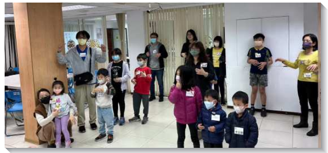
▲ 聖徒邀約親子參加兒童福音活動

我們藉著禱告邀約到許多人，超過所求所想：一位福音媽媽不但帶孩子來，還帶著從台中來看她的姊妹一家四人參與。國小高年級姊妹邀約她們的同學、舅舅、弟弟一同來。還有已過福音出訪接觸到尚未過召