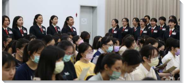
▲全時間訓練學員展覽詩歌

另有姊妹見證，主藉著約翰福音二十章的圖畫吸引她。當馬利亞來到墳墓那裏，沒有看見主耶穌，她就開始哭泣，因為她所愛的主不在了，世界在馬利亞的眼中，不過是一個空白。這使她蒙光照，看見自己對世界仍有許多愛慕和追求，但主要的是一班像馬利亞愛主的人，起來回應祂的需要。因此，姊妹就願意撇棄屬地的