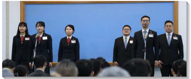
▲全時間訓練學員分享見證

在三場聚會末了，皆有訓練教師給青年聖徒勸勉與鼓勵。一位教師藉著尼希米的領導鼓勵我們，要成為對神有時代的價值的人，就需要是一個『來』的人。如同尼希米親自去到耶路撒冷，在夜間親自查看城牆的情形。因著他是先來到城牆這裏並關心神在地上權益的人，他才能殷呼召百姓：『來罷，我們重建耶路撒冷的城牆。』而全時間訓練就使我們成為『來』的人，在這裏幫助我們得潔淨、受教育、被重構，好使