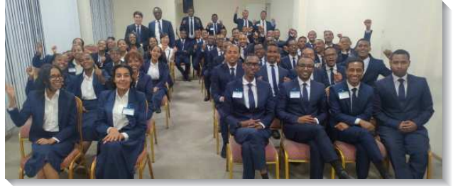
▲在阿迪斯阿貝巴的訓練學員

衣索比亞召會在二〇一六年開始舉辦全時間追求（還不是全時間訓練），至二〇一九年正式成立阿迪斯阿貝巴全時間訓練中心。全時間追求者和全時間訓練畢業的聖徒們領受負擔，他們回到當初來的城市，