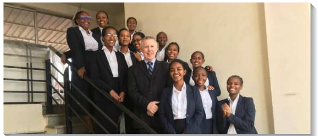
▲訓練學員緊緊跟隨職事愛慕主話

第三，聖徒們相當有身體感，非常關心其他城市的情形，幾乎每次的禱告聚會皆為其他城市爭戰禱告。並且聖徒們也時常前往扶持、加強其他城市的召會。