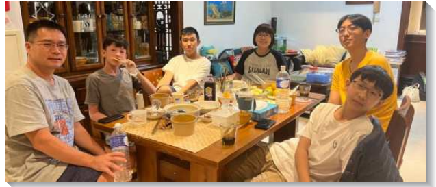
▲青少年至聖徒家中小排相調

另外，也盼望藉此實行讓學生對『生、養、教、建』有負擔。在會所聚集時，多是由服事者帶領並安排，而