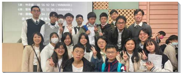
▲學生聖徒們在各面積極操練受成全

藉著以上的操練和實行，學生們『人人盡功用，組組動起來』，每位配搭的弟兄姊妹都同心合意，一同擔起每一場『自己的聚會』，漸漸的由被照顧者轉爲照顧者，學習更主動積極操練靈，因此聚會更加新鮮活潑，滿了生命的供應。在這樣的召會生活中，目前實體到會比例幾乎達百分之百，且有固定參與召會生活的福音朋友加進來。這一年多下來平均主日人數已經從十八位繁增到二十四位，盼望今年能有更多的學生得救，一起投入聖靈的水流，經歷繁茂的復活。（翁高育幸）