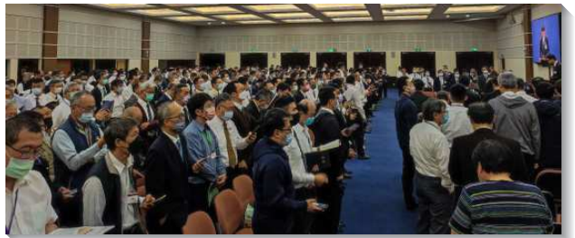
▲ 聖徒參加全台弟兄事奉集調

在三天的集調中，除信息之外，另有三堂專題交通，題目分別是『加強青年人的工作』、『海外及島內的移民開展』、以及『推廣聖徒們追求聖經的生命讀經』。關於加強青年人工作的負擔，近年來，台島眾召會青年人得救的人數逐年下降，為著主恢復的下一代，青年人的工作不僅要著重，更需要加強。在聚集中，有召會見證，在青少年的工作上，藉著得榮少年關懷計畫專案，接觸並得著青少年孩子和他們的家。也有召會見證，在大學的工作上，藉著打開家，勞苦牧養人，而看見大學生的生命長大，並被建造到召會生活裏。