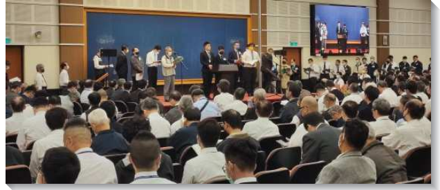
▲ 弟兄於事奉集調中分享

觀、扎實、並深刻的經歷，好使我們得以在各樣的情形中活祂並顯大祂。再如同第七篇，我們需要在生活中經營這位包羅萬有的基督，就是操練我們的靈來接觸祂，使我們對祂有經歷，並帶到召會的聚會中與聖徒們一同分享，藉此而恢復真正的召會生活。