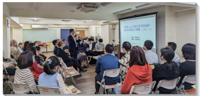
▲弟兄於家長座談會中分享牧養兒女

在弟兄姊妹的努力邀約之下，座談會當天有十四位家長，十六位兒童參加。與會的家長和服事者們都得著激勵，隔週的救恩之路課程也順利開始。有位孩子邀了三位同學來參加。有一位五年級兒童已經中斷聚會一段時間，後續也恢復了聚會。藉著邀約人參加座談會，我們也得著機會接觸平常不易接觸到的家長。兒童是個大的福音，求主繼續記念這些五年級的孩童，不只得著他們，更使救恩臨到他們的全家。（陳達恩）