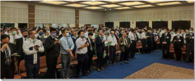
▲ 全台弟兄事奉集調在中部相調中心舉行

—— 〇二三年全台弟兄事奉集調於四月六日至十五日分三梯次於中部相調中心舉行。本次集調是自二〇一九年疫情後首次的實體聚集，三個梯次共有一千四百七十八位來自台島各地的弟兄們有分。歷經三年多疫情之下的『遠距』召會生活，首次的實體集調更別具意義。弟兄在信息中交通到，經過了這次的疫情，全球基督徒的人數明顯下降，基督徒的聚會人數更是大受影響。這使我們眾人深覺，我們仍能聚在主的名裏，領受那靈向眾召會即時並新鮮的說話，著實是主莫大的憐憫和恩典。