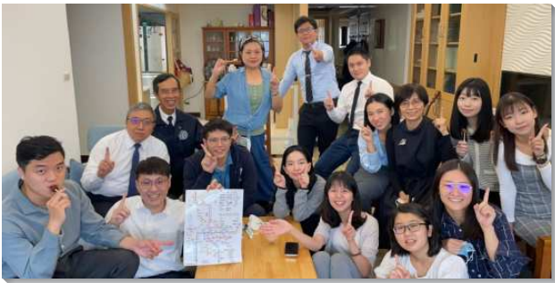
▲青職聖徒邀請朋友參加主日聚會

去年七月，本會所和八十一會所配搭成立一個青職區，聖徒平均年齡二十六歲，盼望以青職群聚的特性吸引青年人前來，彼此成為清心呼求主的屬靈同伴。過程中，本會所嘗試幾項實行，使青職聖徒能更認同並經歷