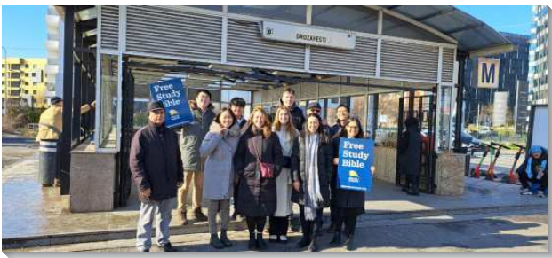
▲聖徒至地鐵站接觸人發送聖經

約在一個半月前，弟兄們就開始在線上為著本次福音行動有交通和禱告。包含福音隊的接待和交通等事務的安排，為天候禱告，與為各地聖徒能一同進入福音的負擔，及得著常存的果子禱告。最後的一個月，學員也和要去開展城市的當地聖徒有一週一次的團體禱告交通。