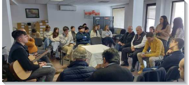
▲來自中東歐的聖徒主日齊聚交通申言

三十日早上九時至十一時是隊員共同追求及配搭的時間，追求內容是李弟兄一九九八年在台北對台灣訓練學