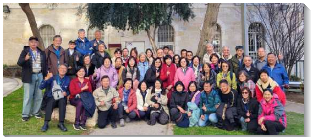
▲聖徒們至以色列訪問耶路撒冷召會

路撒冷召會的成立，曾說過三個『也許』—在耶路撒冷城『也許』將有一個召會。『也許』會所就離橄欖山不遠。因橄欖山是主升天的地方，也是主回來時要降臨之地。『也許』有一天我們要在橄欖山腳下的客西馬尼園，有個禱告聚會，為著主的回來迫切禱告。