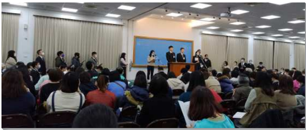
▲大安區冬季現場訓練在三會所舉行

本次訓練主題是『歷代志、以斯拉記、尼希米記、以斯帖記結晶讀經』。歷代志的主題是神在人歷史中行動的全部紀事，是為著完成祂永遠的經綸。以斯拉寫歷代志是為著被擄歸回的以色列人，該如何在美地上生活，這關係到神的行動和我們在主恢復裏的生活。