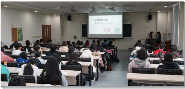
▲得榮少年參加生命體驗營

兩天的營期內容豐富，隊輔們以十分詳盡且生活化的方式帶領得榮少年進入『人生的奧祕』這四把鑰匙。每把鑰匙都是真理的結晶，讓得榮少年認識人存在的意義。除了生命成長課程以外，營隊中亦安排與城市科大合作的科系職業體驗課程，讓得榮少年們一同至餐飲系體驗壽司製作，和資工系體驗VR等不同領域的專業活動，以開廣得榮少年有不同的視野以期在往後生涯中能有更多的選擇。第二日下午還有公共服務，參觀並整潔校園，讓少年們體驗施比受更有福。