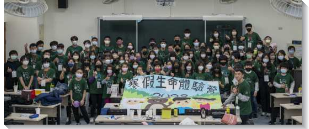
▲得榮基金會舉辦得榮少年生命體驗營

教師向少年們介紹大數據、物聯網、人工智慧等科技發展的趨勢，鼓勵得榮少年往這方面學習。少年在教室中體驗與人工智慧機器人溝通、下指令，也玩VR和AR的遊戲，非常有趣。第二是餐飲體驗課程，以四種壽司種類為主題，分組製作一道日式料理。講師在解說過程中，輔以壽司的節慶背景，幫助少年進一步認識日本文化。得榮少年藉此難得的機會，一步一步完成色香味美的壽司料理，因而洋溢出滿足的笑容，也在過程中經歷與同伴們相互配搭的喜樂。