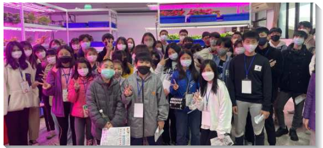
▲得榮少年參與資工體驗

有位陪伴得榮少年的隊輔分享，她在豫備四把鑰匙課程的過程中除了學習如何講說並將基督供應到人裏面，也更主觀地摸著並經歷這福音的內容。在過程中一再地從主的話得供應，且藉著與不同弟兄姊妹們在靈裏配搭而有更多相調並建造，眾人更多經歷祂神聖的分賜。