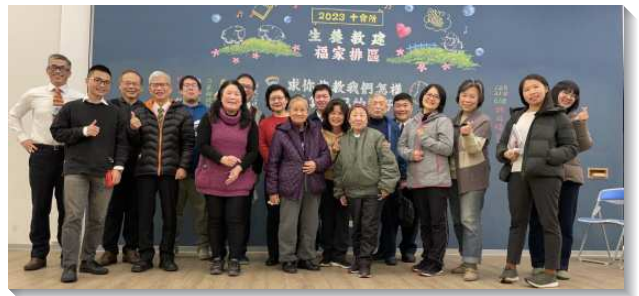
▲聖徒們於每週六早上七時在會所守望禱告

開校園排：與青少年區配搭交通，盼望建立木柵高工、木柵國中、景文中學三所學校的校園排。每週五