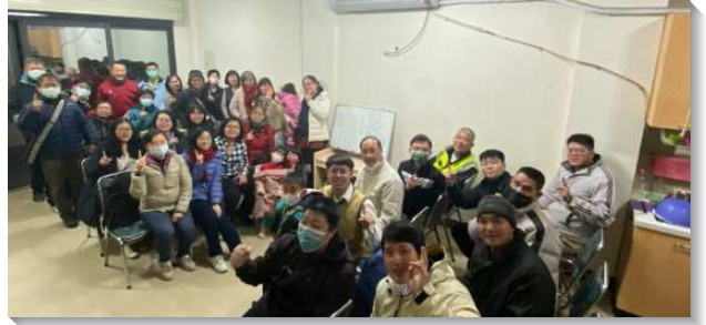
▲訓練學員至鄉鎮福音開展

雲林土庫隊因著召會於去年剛成立，只有一個當地的家和一個移民來的家，人口普遍為年長，加上宮廟林立，更換信仰易遭旁人批評。看似諸多的為難，但