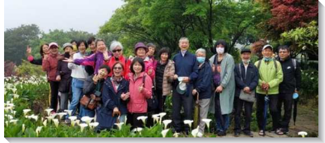
▲長青聖徒與聖徒一同外出相調

當疫情較為緩和之際，長青聖徒們也一同外出相調，除了伸展筋骨，魂裏舒暢，也彼此分享生活中所經歷的基督，更藉著交通彼此關心代禱，使得召會生活更為活絡，全人三部分因此得著復甦和加強。如同詩篇九十二篇十三至十四節所說：『他們栽植於耶和華的殿中，發旺在我們神的院裏。他們年老的時候，