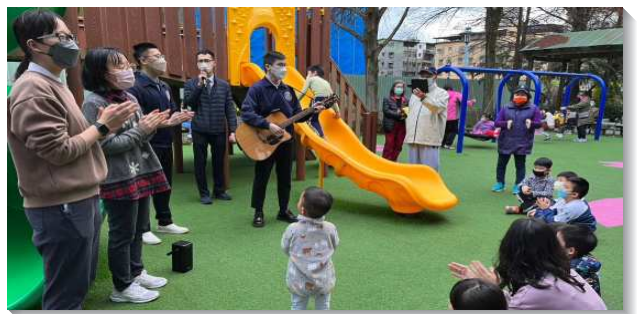
▲訓練學員與聖徒配搭兒童福音

信基網路開展隊在資訊中心（水深之處）協助福音圖文及影片規劃製作，透過網路平台，使福音跨越時空的限制而廣傳出去，拯救人脫離網路世界的霸佔，隨時享受職事話語的豐富。學員們也同時在馬路上接觸信義區忙碌的上班族，得著更多青年人。