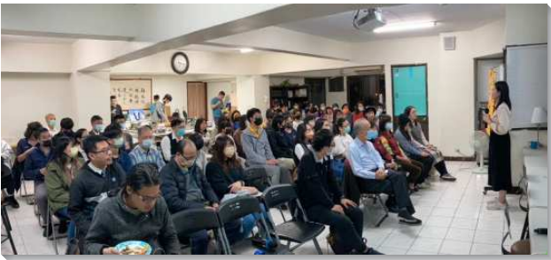
▲訓練學員至鄉鎮與聖徒配搭福音開展

在主豐盛的祝福下，經過五週的開展，共有二百四十九位相信受浸，六百二十三位有分家聚會，第五週帶人參加主日達二百零六位（主日繁增百分之七），最後增出二十一隊，與二個區。今年疫情已經趨緩，各地召會聖徒共同領受負擔，跟上身體的行動，每週約有六百六十位聖徒一同出外接觸人，達到學員所在小區主日基數的百分之二十三。以下列舉幾處蒙恩。