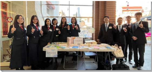
▲全時間訓練學員至各地推廣書報

藉書報開啓，使神的渴望成爲人的渴望—本次書報推廣的書目有五大類，分別是生命的福音、神人的生活、信心與牧養、追求與成熟、正統與恢復。在《神殿與神城的恢復》這本書裏，藉著以斯拉記中以色列人被擄歸回的事例，啓示基督徒被分散在各個地方，實在需要歸回並被恢復。並且神渴望我們在合一的立場上敬拜祂，使祂在地上得著一個家，一個居所。藉著這樣的開啓，使我們的推廣帶著神的渴望與負擔，不只是推廣一本本的書，乃是要使人認識神的心意。當我們帶著這負擔到每個會堂裏，人也渴慕從書中看見我們所看見的。盼望藉著這些書報，主能向他們說話，陳明祂的心意是要將祂的身體建造起來，使祂得著在地上的居所！