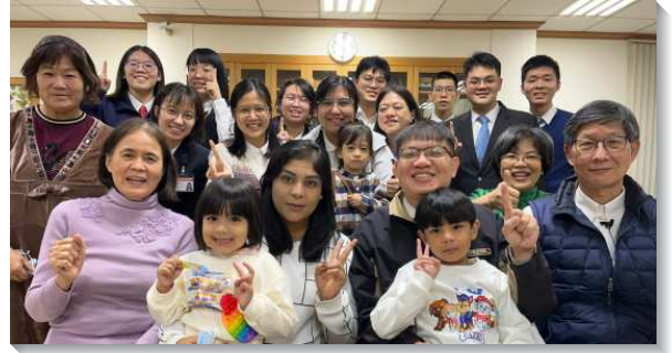
▲全時間訓練學員至高雄推廣書報

進入職事豐富，陳明高峰真理—書報推廣行動前，學員們就率先進入職事的話語中。藉由禱研背講十本好書的內容，我們得著職事話語的供應，並透過書介的撰寫，操練用精要的發表向人分享書報內容。同