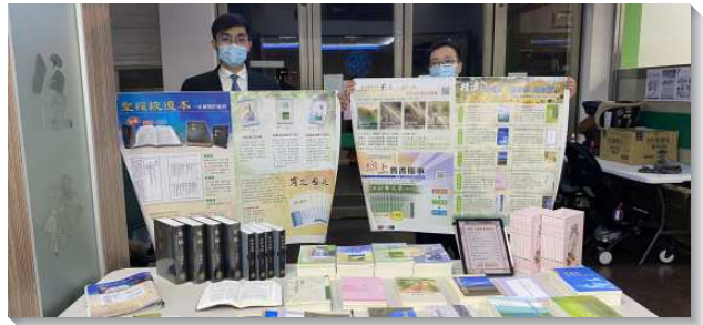
▲全時間訓練學員展示恢復本聖經十本好書

時，爲著介紹恢復本聖經，我們也操練研讀恢復本聖經中重要的註解，藉此向人推廣這本解開的聖經。我們操練抓住機會陳明真理，並積極分享亮光，如腓立比書一章十九節的註解就有關於『耶穌基督的靈』完整且充分的解釋。在每次和弟兄姊妹們分享、傳輸時，我們便操練靈讓神的話能自然湧流出來，不只清楚的說出真理，也使人摸著我們新鮮、火熱的靈。當我們看見弟兄姊妹們聽見分享後，那喜樂並讚賞的面容，我們就再得激勵，也更珍賞並寶愛這分職事的豐富。這十天我們共拜訪一千零五十二間會堂，推廣十本好書一百五十七套，恢復本聖經一百零五本，以及倪柝聲文輯三套、十二籃五十三套。