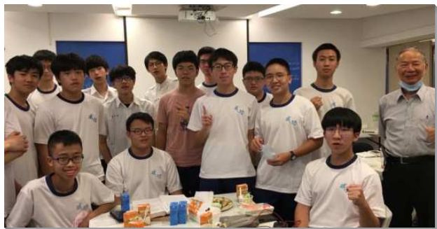
▲聖徒與成功高中弟兄配搭校園排

週四讀經排，聚會人數有十二至十六人。這學期完成以弗所書和腓立比書，進入馬太福音。每次聚會，服事者根據經文註解和生命讀經，出聖經研討題目，會中輪