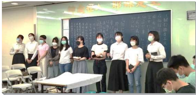
▲青少年們裝備真理享受主話

三、主日聚會：在弟兄們的帶領下，每個主日我們都詳細的研讀一章新約，並且分組討論，之後還有分享時間，帶領青少年操練申言。藉著這樣的成全，期許每一位從青少年區長大的孩子，都能成爲裝備主