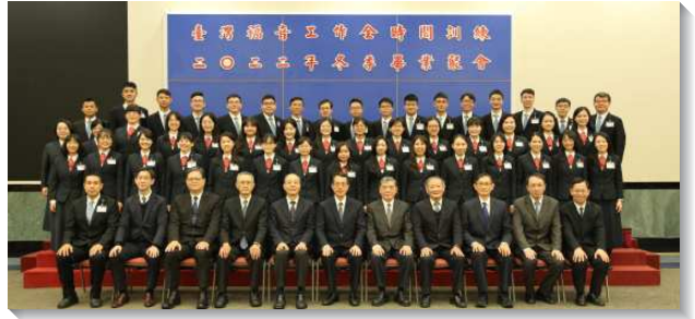
▲全時間訓練畢業學員與教師們合影

練看見活力排與神命定之路的寶貴，藉著親密透徹的交通與禱告，在靈裏真實相調為一。神命定我們前去結果子，我們要先被成全，能以成全聖徒，為著職事的工作，就是建造基督的身體。為此，他們願意恢復對主起初的愛，一生作拿細耳人，豫備新婦，把主迎接回來。