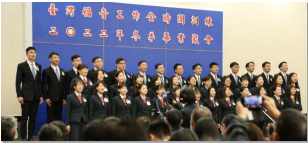
▲全時間訓練畢業聚會在信基大樓舉行

聚會開頭，教師首先感謝弟兄姊妹的關心與扶持，使訓練學員可以心無旁騖地完成訓練，也感謝父老與聖徒們的代禱與供應，使訓練在疫情嚴峻的情況下，能繼續訓練一批又一批的青年人。學員們展覽詩歌『國度—作操練與獎賞』，說出今天的畢業聚會不只是畢業學員的成果展覽，更要成為他們的加強，使他們像使徒一樣，努力向前，抓住關鍵的操練，一直出代價，在各地召會主動積極的盡功用，有分職事的工作，建造基督的身體，帶進新的復興，轉移這個時代。