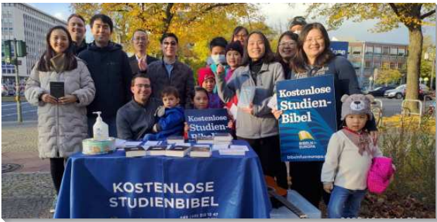
▲聖徒們至德國柏林配搭傳福音

本次福音行動起始於神命定之路的實行。從二〇二一年初，關於實行神命定之路的負擔從在北德的弟兄們開始。不久之後，在德語區（德國、瑞士、奧地利）的弟兄們都一同響應這個負擔。在二〇二一年上半年，有超過三分之一的德國聖徒參加第一階段的訓