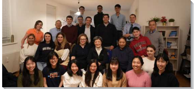
▲聖徒們至德國漢堡配搭傳福音

有一個城市平常約有九十位聖徒參加主日聚會，這次他們有超過五十位聖徒參與本次行動。有些城市平常少於三十位的聖徒聚集，但幾乎所有的人都有分這榮耀的行動，並且在一次的歡迎聚會來了四十位新人。本地學生與社區聖徒配搭一起，接觸這些新人，並分享一篇關於『神對人的需要—以成為新婦並擊敗撒但』的信息。在這兩週的時間裏，數百位敞開的學生被帶到聖徒的家中並被關於神經綸的真理所吸引。在許多目標城市，這些敞開者他們留下聯絡方式並參