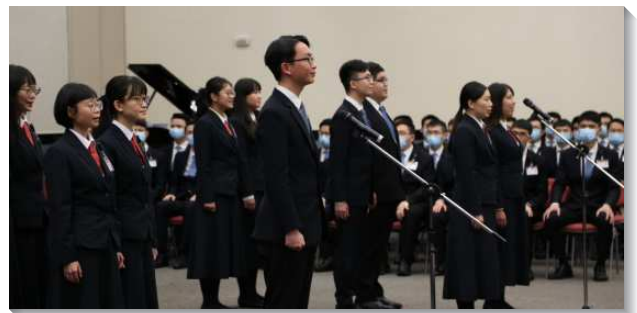
▲畢業學員分享參訓蒙恩見證

最後，教師們勸勉學員們，以主的僕人於一九九五年講的一段話，他希望弟兄姊妹知道訓練的寶貴歷史，訓練一直是倪、李弟兄的負擔。如同以弗所書四章十一至十二節所說，『祂所賜的，有些是使徒，有些是申言