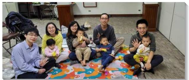
▲兒童家長一同配搭兒童排

感謝主，因著聖徒看重少年人在神面前的價值，我們願意多方學習服事兒童和青少年，讓主得著轉移時代的人。展望新的一年，求主使我們眾人更同心合意，在不朽壞之中愛主並彼此相愛，日後不僅能順利購置新會所，也能照著神所命定之路，實行召會生活。（張正中）