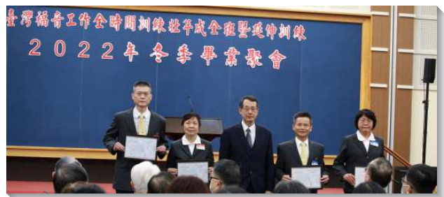
▲壯年班畢業學員獲頒各種獎項

最後服事者在結語的交通時說到，壯年班訓練從二〇〇四年開辦迄今，已經過了十八個寒暑，愈過愈榮耀，盼望春季班能有一百二十位以上新生報名參訓，在訓生繼續參訓至少七十位，使全部受訓學員能達到將近二百位，接受成全後能受主差遣到鄉鎮『移民開展』。弟兄引用李常受文集的一段話說：『訓練是幫助我們在基督裏長大而活基督，憑賜生命的靈行事為人，幫助我們在基督的身體裏作一個正常而盡功