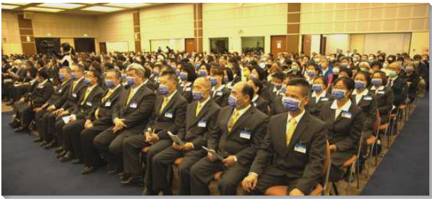
▲壯年班冬季畢業聚會在 中部相調中心舉行

在服事者及教師們勸勉裏，弟兄引以弗所書四章十二節：『為要成全聖徒，目的是為著職事的工作，為著建造基督的身體』。在這一年裏學員奉獻自己交在神訓練的恩手中，在真理上，週週接受了強大的輸供，其中有八項核心課程，每項有十八個小時，另有