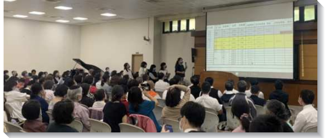
▲兒童服事者暨家長見證與研討交通

第二，注重兒童福音。打開家的同時也要注意兒童福音工作，因為家家都有兒童。我們不僅帶召會中的兒童得救，也要把鄰居、親戚的兒童都帶來，這需要許多人配搭、投入。兒童福音需要家庭的配合，也需青年弟兄姊妹的配搭。第三，積極推動負擔。盼望把姊妹們裏面的火點燃起來，姊妹們在各地召會一面要積極交通負擔給弟兄們，一同來推動兒童工作；另一面要學習不帶頭，並且滿有忍耐，知所進退。第四，鼓勵姊妹們盡感