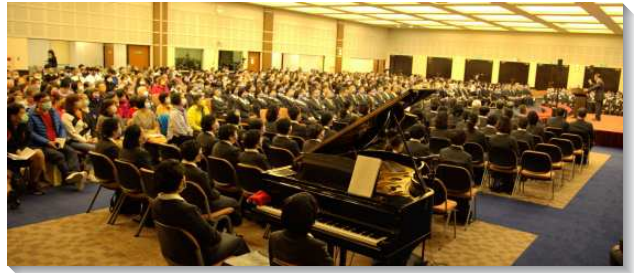
▲各地聖徒參加壯年成全班冬季畢業聚會

壯年班的訓練是『化腐朽為神奇』。這份時代的職事要把我們作成主貞潔的童女，更愛主耶穌，更愛祂的身體並接受神聖三一的供應，逐漸被成全而成為愛。訓練