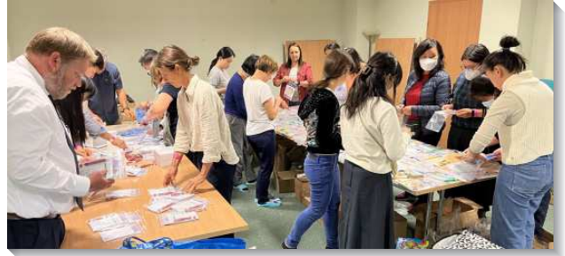
▲聖徒們在東歐配搭包裝關懷包

人道救援中心提供完備的食宿與醫療資源，烏克蘭難民通常會駐留三天左右。幾百位難民並排睡在簡陋的地舖，眼神空洞的吃著救援中心提供的餐點，而牆上的畫作顯出孩子們對和平的渴望，每一幕都令我十分震撼。正好人道救援中心裏面有一台鋼琴，有姊妹天天定時去彈奏詩歌，大家在旁邊唱詩歌，很快就吸引許多人。我們用翻譯軟體和她們分享詩歌，也把握