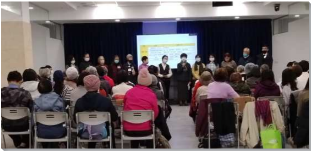
▲聖徒們參加大安區聖徒成全聚會

大安區聖徒成全聚會於每週四上午在三會所舉行，參加的聖徒分別來自大安區的十個會所。聖徒成全每年有春季及秋季兩期，本期自九月起至十二月十五日止，共有十次的成全聚會。每次的內容皆涵蓋四個主題，分別為當週晨興聖言鳥瞰、牧養系列信息、李常受文集追求及舊約聖經。參與的聖徒們除了進入弟兄們每週所豫備豐富的信息和話語，也藉著操練本的幫助，許多聖徒們得鼓勵將所聽見的話實行出來，週週有追求真理、牧養人並撰寫申言稿的操練。