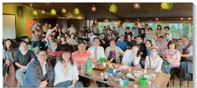
▲聖徒們過喜樂的召會生活

經過這一年不斷的撒種，乘上聖靈的浪潮，順利將福音傳給學校裏的兒童家長，並帶兒童家長得救歸主，實在是滿了喜樂！陸續有許多的兒童與家長與我們聚集，盼望藉著在兒童專項實行上的蒙恩，再得著更多的家與我們同過召會生活。因著文山二、三大區弟兄們帶領，要在疫情共存下過攻勢的召會生活，需要『相調、相調、再增區』，使弟兄姊妹們更多來在一起交通、禱告，並恢復實體相調，也恢復到疫情前喜樂的召會生活。求主不斷擴大我們的度量，更多獻上我們自己，帶進新的復興！（蔡承璋）