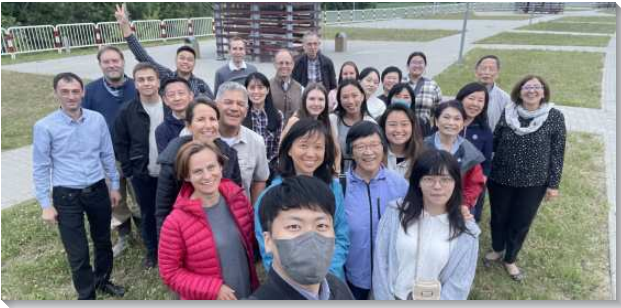
▲各地聖徒配搭至東歐傳福音

每天早上我們共同追求書報『新約福音的祭司』，並配搭包裝『關懷包』，下午分為兩個小隊，分別到普熱梅希爾車站及人道救援中心。主題醒我們這次開展不是一個工作，需要一直操練靈，在靈裏禱讀主的話，使我們在一道水流裏，與主一同行動。