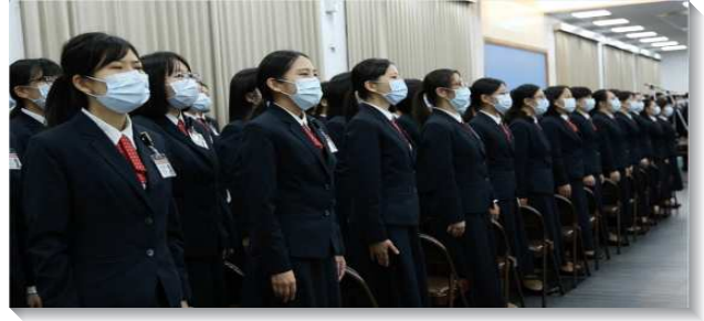
▲全時間訓練學員展覽詩歌

因著家人們的扶持和鼓勵。因此，當天也有一個時段，讓十八位學員在台上向家人表達感謝。雖然有一些學員的家人尚未得救，卻仍體諒並成全兒女們的心願，使他們能有分於全時間訓練。學員們對家人表達感謝的同時，也表達對家人們的愛，期盼這位是愛的神能感動他們，家人們也能早日接受主耶穌作生命。