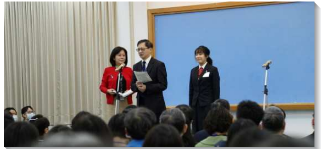
▲學員的家長肯定兒女參訓後顯著的長進

接著，有兩位學員的父母上台分享他們如何放心讓兒女活在召會中和訓練裏，接受最好的教育。有別於時下年輕人對人生汲汲營營的追求，兩對家長分別見證召會生活幫助他們的孩子能在單純的環境中成長，與一班清心愛主的青年人，一起過有價值的生活。他們也珍賞並感謝訓練對學員各方面的成全，使他們的子女在生命和性情上都有顯著的長進，並學習與同伴配搭、牧養造就人，成為基督身體上活而盡功用的肢體。