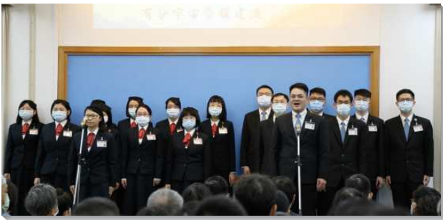
▲學員於全時間訓練家長開放日展覽

為著家長開放日，學員們不僅積極豫備見證與詩歌，更為著家人和聚會有多而又多的禱告。在一次次團體禱告中，學員們更新奉獻自己作基督的一乘華轎，成為祂行動的憑藉，見證身體的合一，憑愛的靈將祂發表出來。聚會開始之前，學員們接待陸續前來的家人及聖徒，關切並問候他們，並引導眾人參觀訓練中心，介紹寢室內務、空中花園、時光走廊、海外開展展覽館以及史料館，讓家長們瞭解學員們平時的生活、訓練的歷史沿革以及訓練八方面的負擔。看見學員們在訓練中心不僅過規律嚴謹的生活，更是帶著榮耀的異象受屬天的成全。