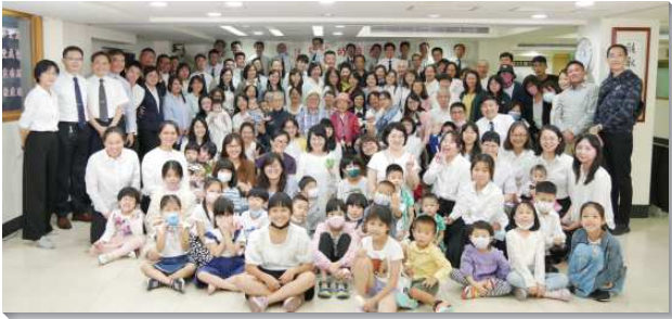
▲聖徒們在生活相調靈中喜樂新鮮

一、晨興：全會所聖徒加入晨興網路群組，由幾位聖徒負責在固定時段打開群組通話，從早晨六點半直到中午，有八個晨興時段。聖徒在適合自己的時段進入群組內，一同晨興享受主並彼此代禱。這不只擴大