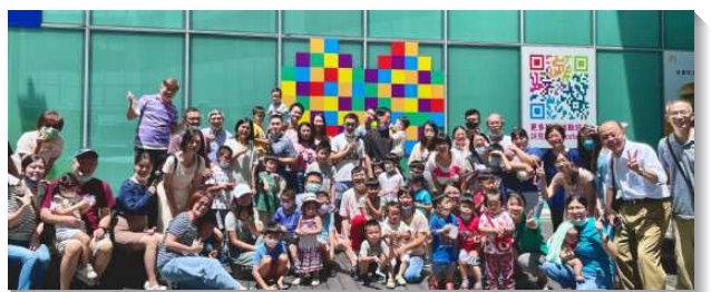
▲港湖區聖徒配搭兒童暑期品格園