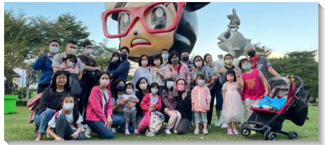
▲聖徒們擴大接觸人牧養人

起初聖徒還有些信心不足，弟兄們鼓勵大家恢復週中與人用餐相調、出外探訪接觸人。甚至連確診都可以成為探望的機會，只要彼此事先聯絡好，將物資放在確診的弟兄姊妹或是福音朋友的家門口，待看望者