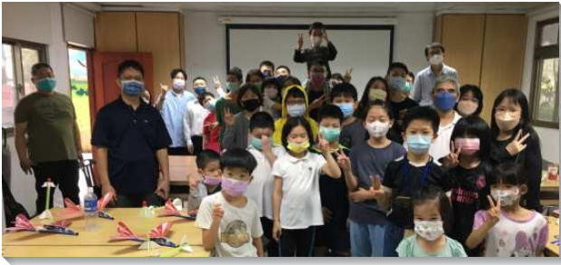
▲聖徒們陪伴兒童參加相調活動

今年三月六日，本會所與三十和五十五會所有集中的擘餅聚會。因受疫情的影響，去年三月到八月暫停實體聚會，待下半年疫情漸緩之下，逐漸恢復實體聚會和召會生活。先於八月二十八日有主日集中擘餅聚會。