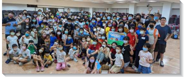
▲聖徒配搭城中大同區親子健康生活園

實體展覽聚會於八月六日和二十日兩個週六，分兩梯次舉行。由隊輔大哥哥、大姊姊帶孩子從詩歌帶動唱開始，邀請福音家長及兒童參加。且規劃『神的創造』、『人體的奧秘』兩個專題，分別由大學生、青少年，以及醫生弟兄配搭，幫助孩子們更認識創造天地與人的神。也安排了手作活動—製作時鐘，題醒孩子們看重時間而有真準緊的操練。下午就是孩子們最期待的大地闖