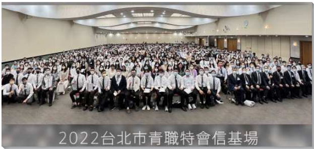
▲2022年青職聖徒特會於信基場地

— 〇二二年台北市召會青職聖徒特會於九月九日至十日在信基大樓和一會所，分兩個實體聚會場地同步舉行，亦開放聖徒們線上參加。今年共有近二千四百位聖徒們有分青職特會，包括約一千五百位青職聖徒，以及近九百位關心青職的聖徒。因著參加人數眾多，本次特會按實體會場、座位及各大區青職基數，並依照政府公佈的聚會方式，信基、港湖、文山一、二、三大區的聖徒們至信基大樓聚集。城中、大同、士林、北投、大安大區的聖徒們至一會所參加。各會所青職聯絡人，於特會兩週前的豫備聚會，就聚在一起交通、禱告、進入負擔，並將電子邀請卡、特會倒數宣傳影片廣發至各會所群組，竭力邀約青職聖徒參加特會，一同過屬靈的節期，求主焚燒、挑旺並得著青職聖徒。