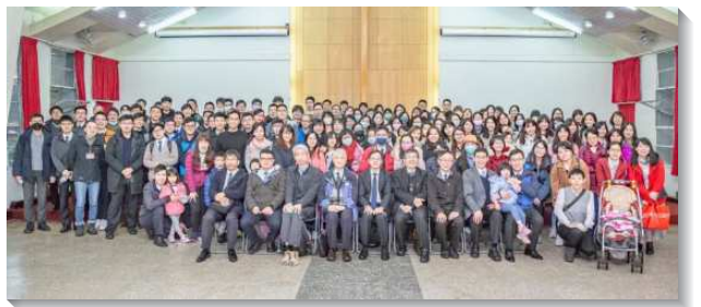
▲青職聖徒在召會生活中受成全

最後，在兩天特會下午的座談時間，特別邀請召會中的父老們，為著青職聖徒最切身的『職場』及『婚姻』給予幫助，根據聖經及生命經歷，解答聖徒們實際的問題。在職場部份，除了安排青職聖徒作見證，也有父老們話語的開啓，以及個人的經歷與見證，勉勵青職聖徒要公開承認自己是基督徒，向人傳福音，聖別有見證，不被世界得著，也不作不聚會的基督徒。在婚姻部份，