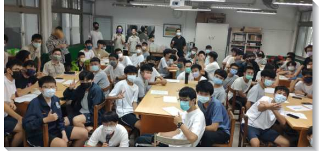
▲建中弟兄們配搭校園福音

聖徒們為著校園福音，全力扶持，使敞開的福音朋友能被帶到召會生活中。有些師母常年固定為學生們準備福音晚餐，成為邀約同學來聽福音並一同讀書的憑藉。漸漸有更多學生願意來會所用餐讀書，並因而得救。聖徒們也常愛筵學生，會所也補助學生參加特會相調的費用，甚至是獎學金，使學生們得著扶持，