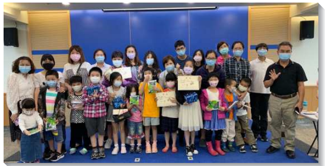
▲聖徒一同配搭服事兒童

二、青少年：年初成立新的青少年小排，原本只有兩位青少年，目前已繁增到八位。蒙恩的點在於生活上的相調。服事者陪伴青少年，邀約至家中愛筵相調，更一同進入對主話的享受。暑假期間，舉行青少年生活營，每天早上都有大哥哥帶著青少年晨興、背經，也學習