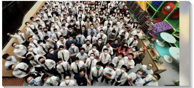
▲2022年青職聖徒特會於一會所場地

除信息外，兩天各有三十分鐘的專題，分別安排不同青職聖徒作見證，盼望藉著見證彼此激勵，更新奉獻，