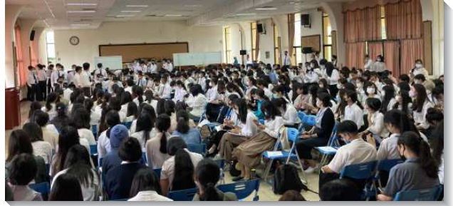
▲大學聖徒在期初特會中踴躍分享

第五篇看見神福音的終極總結是實行召會生活，這是我們勝過撒但的憑藉。羅馬書開始於神的福音，結束於保羅的福音，啓示完全的福音總結於眾地方召會，成了