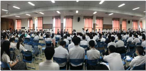
▲大學聖徒期初特會在金山青年活動中心舉行

第一篇信息看見，我們所得的生命是接枝的生命。我們應當活接枝的生命，活在與基督生機的聯結裏，使我們得以進入基督身體的實際。基督身體的實際是一種生