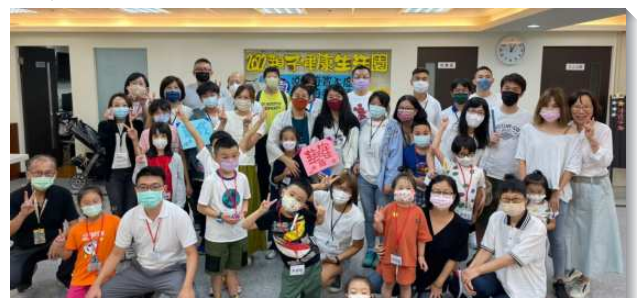
▲聖徒一同配搭親子健康生活園

感謝主，此行藉著弟兄姊妹生機的配搭，使福音朋友受主吸引，相調亦使聖徒們滿了喜樂、更有活力，同心合意，與主是一，帶進主的祝福。（劉昌盛）