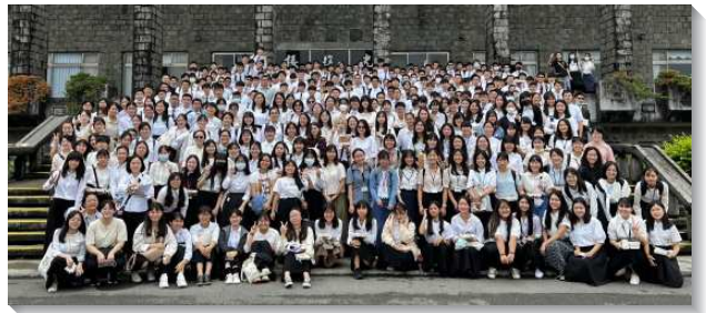
▲大學聖徒在期初特會中更新奉獻

特會中專題一說到照著神命定之路實行福音祭司的職任，看見新約福音的祭司乃是我們的天職，不僅帶人得救，更要成全人起來盡功用，將人成熟的獻上。這全來自於我們的努力，我們必須竭力奮鬥，親自勞苦，使召