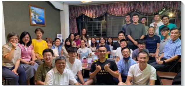
▲聖徒們喜樂參加青職小排彼此供應

這樣的小排生活不但成全青職在話語上有裝備，得人結果子，更使青職們成為同伴，建造在一起。社區