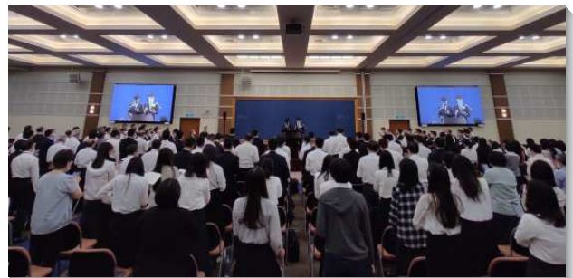
▲同工們於訓練中同受成全

第五篇說到『全體事奉，生機建造』，基督身體的事奉。一個生機的身體就必須是全體的。全時間者在各地召會服事，要成全聖徒在三方面的操練：學習真理，學習成全人，學習開展。身體的建造不是藉著特別有恩賜的人直接來建造，乃是被成全的聖徒，來建造身體。我們在各地的服事，要非常注重成全人，不是代替聖徒。無論如何都要根據神的說話來成全人，惟有這樣基督身體才能殼得著完全的建造。