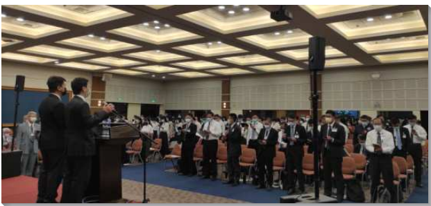
▲秋季全台同工成全訓練在中部相調中心舉行

成全訓練共有六篇信息，交通全時間服事者該有的異象、生活和工作。第一篇說到『為著主終極的恢復，我們需要看見保羅完成職事和約翰修補職事的中心啓示』。為著召會的產生、建造與完成，我們需要基督天上的職事、保羅完成的職事及約翰修補的職事，這三個職事的中心啓示乃是基督，基督在我們裏面成了榮耀的盼望，這包羅萬有的一位，是我們的頭，我們作為召會是祂的身體，基督也是我們生命的供應，使祂得彰顯。藉著這三個職事帶進神終極的行動，今天主正在呼召我們、得著我們，有分祂終極行動。