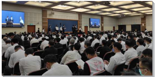
▲全台同工們於成全訓練中踴躍分享

第三篇是『藉著奇妙的信和超優的愛，作中流砥柱過召會得勝的生活』。在召會墮落的流中，我們需要讓信在我們裏面增長，運著運用奇妙的信，禱告仰望三一神更多充滿在我們裏面。超優的愛，叫我們享受的三一神供應和我們同作同伴的弟兄姊妹。行起初所行，讓我們