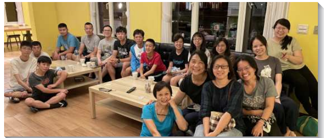
▲聖徒們為著福音配搭開展得人

已過暑期，大專生們藉著各樣行動，與其他校園相調彼此激勵。得救四個月的小羊，也能與其他校園中幹一起有奉獻宣告。主在校園的開展，實在有聖靈的工作，藉著社團作為新生福音的憑藉，得著許多新生名單。新學期的校園排，主也加給我們許多新人。願主繼續加強祂在校園的見證，並興起眾聖徒為著北市大天母校區開展得人，在身體交通中一同代禱。（李偉明、鄭易軒）