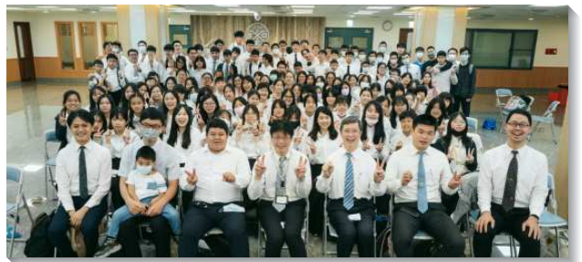
▲文山一大區青少年暑假特會

兩天特會結束，最後一天改為集中，為讓眾人的靈更火熱也更高昂，也請同工弟兄來釋放話語，拔高聚會的質。最後一天的特會，弟兄鼓勵將要參加全台一週高中成全的青少年能率先操練靈。藉著彼此激勵，他們一位一位釋放靈禱告，邀約同伴一同上台分享。願主保守青少年在環境中揀選生命，有神人調和的生活，與主有愛的交通，藉著生命樹的原則來享受基督。（巫欣倫）