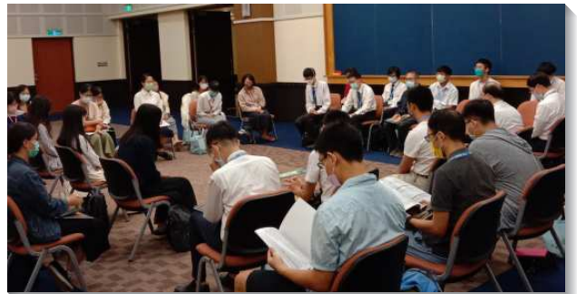
▲聖徒們於分組時間中分享蒙恩見證

在職聖徒見證，在職場中抓住主所給的位分，向軟弱虛空的人傳揚福音。海外開展負擔交通，弟兄們交通來自全球開展的情形及需要，眾人同領受託付，更新奉獻自己。分組時間中聖徒們分享蒙恩見證，不管是在學或是在職聖徒，彼此都得著身體的供應。有位聖徒邀約接觸已久的大學同學，同赴路加集調，藉著眾人的分享、弟兄們加強的話，主在這位新人裏面激動她，將自己完全交給主。兒童們在這次的聚集也收穫滿滿，服事者安排相調中心的巡禮，帶孩子認識相調中心的起源與規劃，也帶著孩子們操練靈接觸神。願主祝福召會中的下一代，興起更多愛祂的人！