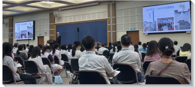
▲弟兄於路加集調中交通海外開展負擔

在校園方面：弟兄姊妹們見證主在校園中的行動與工作，為祂的恢復豫備愛主的路加聖徒。期盼引燃學校人數較少之校園福音的熱火，且記念召會的下一代，走被真理構成的路，被培育為建造基督身體的貴