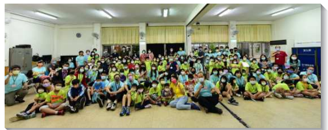
▲大安區親子生活園展覽在八會所舉行

整體親子園活動從七月九日開跑，各家各排在線上彼此有交通，並在群組中分享各家操練的照片、影片，使眾人得激勵。雖然是在線上分享，彼此仍連繫的很緊密。我們也特別於七月十五日、二十九日、八月十二日規劃三次線上相調。為著這個創新的實行，