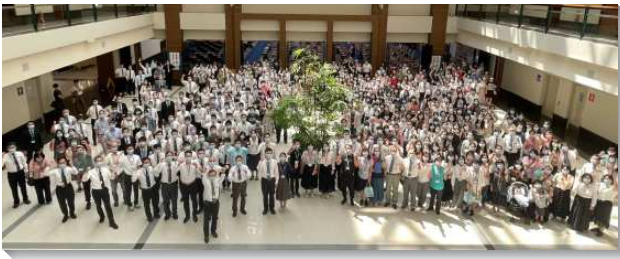
▲2022 年路加聖徒集調在中部相調中心舉行

去年因疫情之故，路加集調採線上聚會。彰投區路加集調配搭服事的弟兄們在聚會未了，在鏡頭前向全台的路加聖徒發出邀請的呼聲。在接近一年的豫備過程中，雖然身處疫情的湍流，有許多的不確定，但我們率先踏下信心的腳步，向主禱告要有實體的聚會，因為防疫與