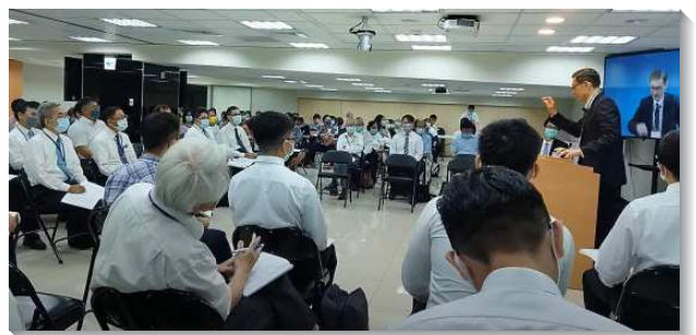
▲大同區夏季現場訓練在七十四會所舉行

願主祝福祂的召會，藉著祂時代的說話，帶領聖徒們在生命中作王並過得勝的生活，而成為生命的城新耶路撒冷，成為神在地上的見證和彰顯！（羅仁德）