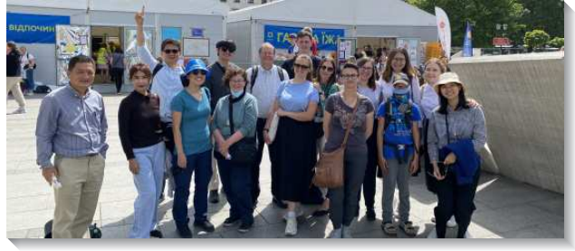
▲各國聖徒至波蘭配搭短期福音開展

在開展中，我十分享受和弟兄姊妹們的配搭。在還未出發到開展地前，我就已經充分的得著了從主、從身體而來豐富的供應。當我們來在一起交通或打包關懷包時，總是滿了禱告、代求和甜美的交通。聖徒們向彼此完全敞開，分享他們對主個人的經歷、開展、服事主、服事召會的經歷、得救的經歷等等。過程中，我實在珍賞立方體的召會生活，與眾聖徒一同領略基督的闊、長、高、深，看見聖徒們對彼此真實的關心和愛。我們