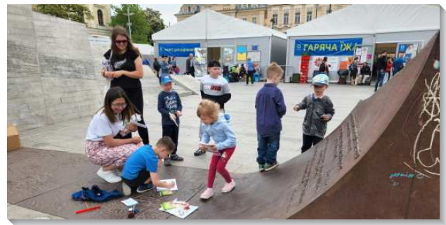
▲聖徒們配搭接觸兒童和母親

在配搭過程中，我也學著與人有更敞開的交通，主動去找當地的聖徒和烏克蘭的學員們交通。一位烏克蘭學員姊妹牧養人的靈叫我深受感動，雖然她的家鄉處在危險之中，但她卻沒有不安或焦慮；而且她還在訓練中，常需要豫備考試和見證，但她仍然心繫著小羊，迫切為人的情形禱告，積極尋找配搭，邀約聖徒認識新人，這使我非常受激勵。