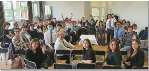
▲各國聖徒至波蘭配搭短期福音開展

我於五月九日抵達波蘭第二大城克拉科夫，也是波蘭的舊都，參加第三梯次的開展。當地的召會約有十五位聖徒，有四個家，七位全時間服事的弟兄姊妹，一位大學生。我們這隊有十二位分別來自美國、加拿大、馬來西亞、韓國及台灣，再加上四位烏克蘭學員和兩位當地的全時間聖徒，共十八位在兩週期間一同配搭傳福音。