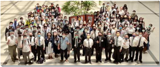
▲全台教職員相調聚會在中部相調中心舉行

在開頭『大專校園工作的藍圖與負擔』的信息中說到，台灣實行新路的前幾年，就盼望福音的火能厲害的『燒！燒！燒！燒校園！』。已過二十多年來，全台大學生人數因著大學廣設而大幅增加，但是大學校